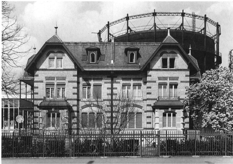
Schlieren, Gaswerk, 1900 nach Plänen von Stadtbaumeister Arnold Geiser erstelltes Angestelltenhaus für zwei Familien, Südfassade. Im Hintergrund Teleskopgasbehälter aus der Gründungszeit, Inhalt 25 000 m 3 , Höhe 34,5 m, Durchmesser 36,4 – 38,6 m.

In römischer Zeit dürfte Dietikon mit seinem grossen Gutshof (ca. 20 vor bis 320 nach Christus, 13 Hektaren Fläche) ein agrarisches Zentrum gebildet haben. Begürtet waren in der Region neben dem Grosse und dem Fraumünster in Zürich die Klöster St. Blasien, Muri, Engelberg, Wettlingen und Fahr. Seit dem Spätmittelalter war es immer mehr die Stadt Zürich, die ins Geschick der Landbevölkerung eingriff. Das Hochgericht war aufgeteilt: Zur Grafschaft Zürich gehörten Birmensdorf und Aesch. Zur Grafschaft Baden zählten die übrigen Orte. 1989 erfolgte die Aufhebung des Bezirks Zürich und die Vereinigung der Gemeinden im Bezirk Dietikon.