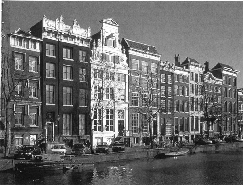
Amsterdam mit einer seiner malerischen Grachten.