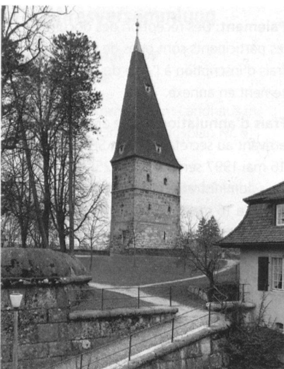
Solothurn, Krummturm, 13./15. Jahrhundert.

Die Aare war Anlass zur Gründung des römischen Salodurum gewesen, und mit dem Fluss blieb Solothurn bis heute schicksalhaft verbunden. Der Rundgang widmet sich städtebaulichen Aspekten einer Flusstadt; wir besichtigen dabei u.a. den Rollhafen (1697) und das Landhaus (1720). Eine gewaltige Herausforderung bildete früher die Zuleitung und Verteilung des Trinkwassers und des Bachwassers für die Energiegewinnung. Wir spüren alte Wasserführungen auf und besuchen die alten Brunnen, insbesondere die prächtigen Figurenbrunnen des 16. und 17. Jahrhunderts.