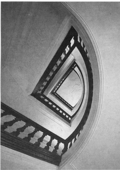
Bischofzelle, Grubenmannsches Haus, Marktgasse 4, Lichthof mit den im «Dreiviertelakt» hochgeschraubten Balustertreppen.

Den komplexen Fragen um die Vertikale Erschliessung historischer Bauten widmet sich das diesjährige Winterkolloquium an der ETHZ. Das Kolloquium findet alle zwei Wochen statt: 31. Oktober 1997; 14. und 28. November 1997; 12. Dezember 1997; 9. und 23. Januar 1998; 6. Februar 1998. Die Kosten von Fr. 30.– sind an der Kasse zu bezahlen, ETH Hauptgebäude F.66 (bis 16.00 Uhr) oder auf das Postscheckkonto 30–1171–7 zu überweisen (Vermerk: Vorlesungsnummer 12–451). ICOMOS