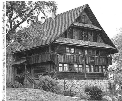
Boswil, Wohnhaus aus dem 18. Jahrhundert mit originaler Fenstersituation, Aufnahme 1989.

In der Darstellung der Siedlungslandschaft beschränkt sich der Verfasser auf die Präsentation ausgewählter Höfe, Weiler und weniger Dorfanlagen. Dabei war eine umfassende, zu den Anfängen der Siedlung zurückreichende Beschreibung, insbesondere der Dörfer, weder beabsichtigt noch möglich. Das Hauptaugenmerk der Siedlungsanalyse richtet sich auf die Verhältnisse im 19. Jahrhundert und erfolgt anhand einer Auswertung von Gebäudeversicherungsregistern. Mit statistischen Mitteln, ergänzt durch eindrückliche Fotos, entsteht so ein interessantes Bild der Siedlungszusammensetzung nach Zahl und Funktionen der Gebäude, ihrer Materialisierung, aber auch über Zeitpunkt und Ausmass von Veränderungen. Einen wichtigen Aspekt bilden die das Ortsbild prägenden Dachformen und Bedachungsmaterialien.