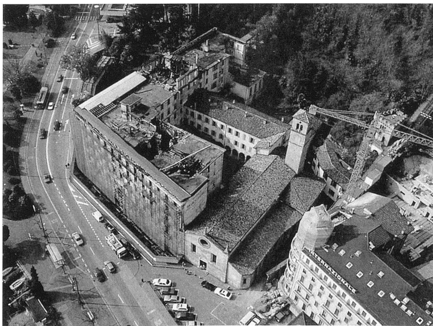
L'ex Albergo Palace a Lugano, stato attuale. La ripresa aerea mostra chiaramente la struttura dell'ex albergo con le parti in origine appartenenti all'antico convento, ora iscritte nell'elenco cantonale dei monumenti storici. Sulla destra è riconoscibile la chiesa di Santa Maria degli Angeli.