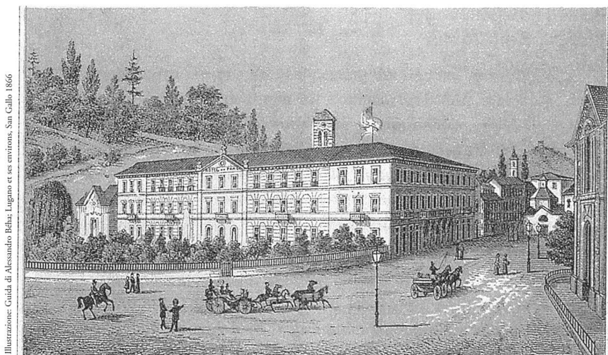
L'Albergo del Parco a Lugano (nome originario dell'Albergo Palace) in un'illustrazione pubblicata nella guida di Alessandro Béba «Lugano et ses environs» (San Gallo 1886). L'immagine mostra l'albergo nel suo stato originale, ovvero dopo la trasformazione del convento ad opera dell'architetto Luigi Clerichetti nel 1851-55 e prima dell'aggiunta di due piani nel 1903.

Il terzo gruppo è minoritario e vi appartiene anche l'autore di questo articolo. Esso sostiene l'opportunità di tornare al volume del Clerichetti (1855) e di restaurare integralmente tutte le strutture superstiti di