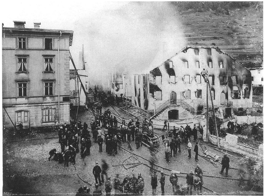
Dorfbrand in Susch vom 3. November 1900, bei dem entlang der Flüelastrasse 15 Häuser samt Ställe sowie die katholische Kirche vernichtet wurden.