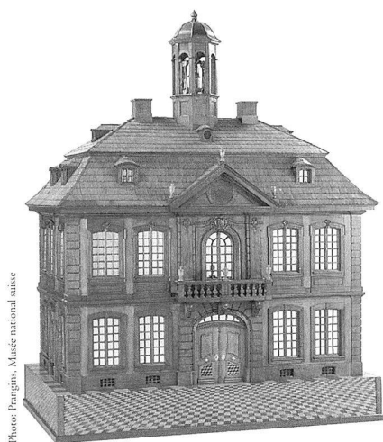
Kaléidoscope sous la forme d'une maison de maître, 1781. – La «télévision» du XVIII e siècle: un jeu de perspectives et d'effets lumineux amène le monde entier dans l'appartement.