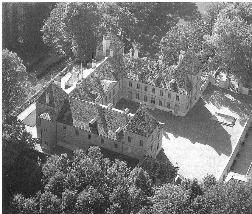
Château de Prangins, l'«Antenne romande» du Musée national suisse, inaugurée en juin 1998.

L'exposition permanente, d'une surface totale d'environ 2500 mètres carrés, est présentée sur quatre niveaux dans le Château (rez-de-chaussée, étage, combles, caves) et sur deux niveaux dans la dépendance. Elle permet de parcourir l'histoire