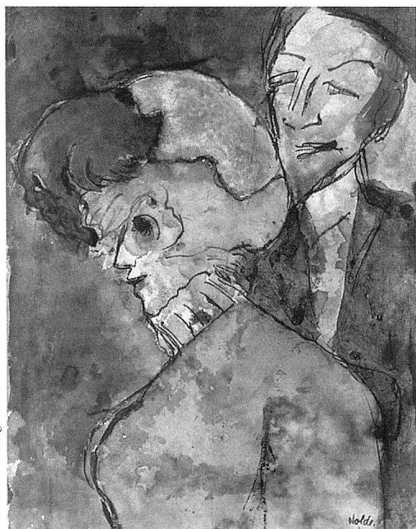
Emil Nolde, Dame und Herr , 1931–1935, aus der Reihe der «Phantasien», Aquarell, 45,6 × 34,6 cm, Nolde-Stiftung Seebüll.