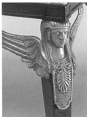
5 Fauteuil mit altägyptischen Motiven, Paris, um 1805, Schweizerisches Landesmuseum Zürich. – Die im ausgehenden 18. Jahrhundert einsetzende «Ägyptomanie» geht nicht zuletzt auf die Faszination durch die völlig fremde und nicht nachvollziehbare Bilderwelt des alten Ägyptens zurück. Das alte Ägypten wird als historische Traumwelt verfügbar und wieder hervorbringbar. Mozarts «Zauberflöte» 1791 und Napoleons Ägyptenfeldzug von 1798 haben stark zur Verbreitung dieses Mythos beigetragen, der erst durch die Entzifferung der Hieroglyphen in den 20er Jahren des 19. Jahrhunderts eine neue Gewichtung erhielt.

den als eigener Wert verstanden werden will. Diese grundsätzliche Position war es auch, die es dem Historismus erlaubte, mehr als eine Position der Geschichtsschreibung zu sein. Geschichte wurde für die Kunst und Literatur verfügbar, verpflichtend und darstellbar.