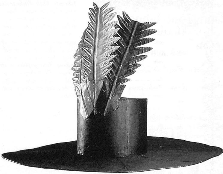
3 Freiheitshut aus Stäfa, 1798, Bemaltes Eisenblech, Schweizerisches Landesmuseum Zürich. – Seit dem 16. Jahrhundert wird in der Schweiz der Freiheitshut oft als Tellenhut abgebildet; die phrygische Mütze bleibt der gelehrten Ikonographie vorbehalten. Die Trikolore – das eigentliche Erkennungszeichen der Revolution – wird hier im Federbusch aufgenommen: Rot, Gelb und Grün sind die Farben der Helvetischen Republik.

kommen aber die neuen Züge dieses Tanzes zum Tragen: Das Primat der Paare wird als Zügellosigkeit und Unsittlichkeit verstanden, die neue Bewegungsfreiheit als Chaos wahrgenommen.