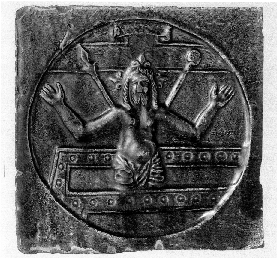
8 Ofenkachel mit der Darstellung von Christus als Schmerzensmann aus der Tumba steigend, 2. Hälfte 16. Jahrhundert, 18×18 cm, grüne Glasur, Kachelrumpf abgebrochen, Historisches Museum Luzern, HMLU 1378. – Die Darstellung ist eher ungewöhnlich und bislang auch auf keine druckgrafische Vorlage zurückzuführen.