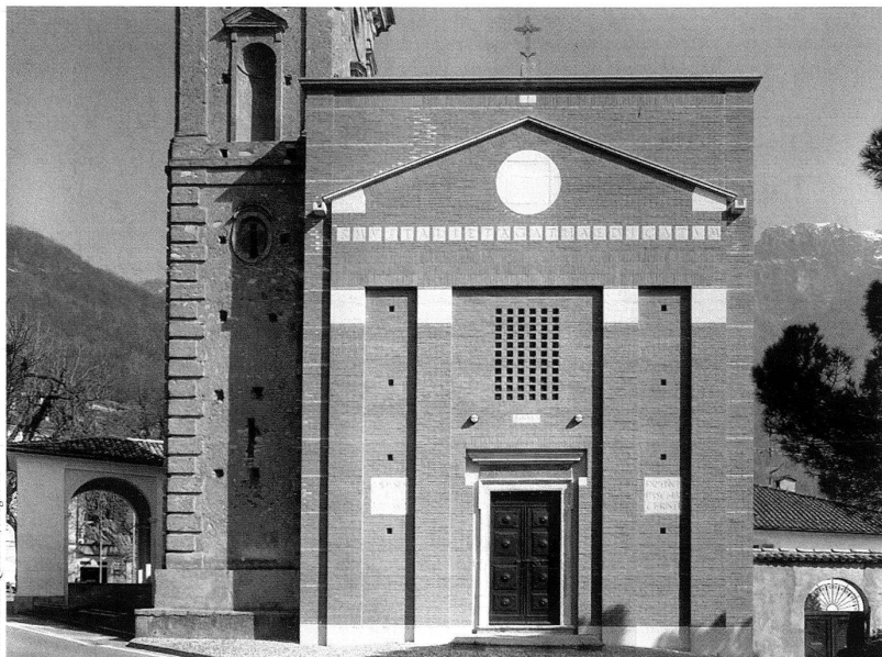
Saint-Vitale et Sainte-Agathe, vue de la façade.

L'architecture structure la perception, le parcours que fait le regard se portant alternativement sur la surface de pierre du campanile, puis sur les surfaces crépies de l'église et ensuite sur la surface de brique de la façade. Le regard saisit l'évolution historique. Nous en comprenons les strates. Notre perception a changé. L'église se lit comme un monument actualisé, inscrit dans la continuité de notre temps. L'intervention de Tita Carloni s'ajoute à une architecture existante, dont il a repris des éléments dans une préciosité chromatique particulièrement réussie. La couleur de la brique rappelle la couleur du camaïeu d'origine. Les fresques en tant que telles ont disparu, mais leur dessin/dessin réinterprété est réintroduit sous forme de plaques blanches, aux épigraphes en lettres dorées, comme d'autres éléments