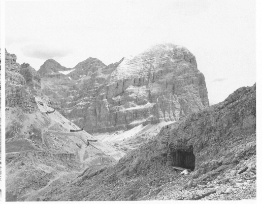
Walter Niedermayr, Rifugio Lagazuoi Tofana, 1993, je 106x133cm / 106x133cm ognuna, Courtesy Galerie Anne de Villepoix Paris.