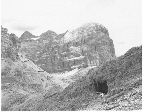
Walter Niedermayr, Rifugio Lagazuoi Tofana, 1993, je 106x133cm / 106x133cm ognuna, Courtesy Galerie Anne de Villepoix Paris.