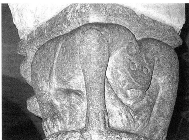
Cripta, capitello con animale bimembre.