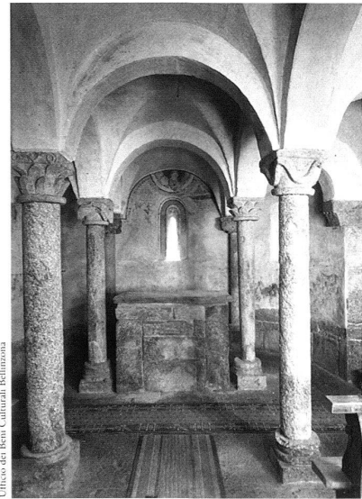
Giornico, San Nicolao, La cripta.

Nel resoconto di un sopralluogo compiuto dalla Commissione incaricata dei restauri del 1940-1945, si legge «Tracce di policromia rimaste su qualcuno dei capitelli della cripta saranno conservate e fissate».