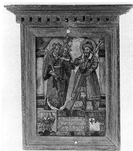
4 Monogrammist SHB[VR], Figurescheibe Hertzig-Wick, 1607, Glasmalerei, Musée National de la Renaissance, Ecouen (aus der Sammlung des Musée de Cluny, Paris). – Die kleine Rundel mit dem Berufswappen des Glasers dient als bunte Fensterzierde.