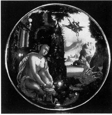
Hans Conrad Gyger (zugeschrieben), Fusschale mit Hinterglasmalerei, Aufsicht auf den Schalenboden mit Andromeda, Zürich um 1630, Durchmesser 16,5 cm, Schweizerisches Landesmuseum, Zürich.

Das Schweizerische Landesmuseum, das einige bedeutende Objekte der Hinterglasmalerei aus Zürcher Produktion des frühen 17. Jahrhunderts besitzt, hat vor einigen Jahren in Zusammenarbeit mit dem Bayerischen Nationalmuseum in München die Restaurierung dieser farbigen Kostbarkeiten aus Glas an die Hand genommen. In einer kleinen, exquisiten Schau werden die frisch restaurierten Stücke, ergänzt durch einige Vergleichsbeispiele, nun der Öffentlichkeit vorgestellt. Die von den beiden Museen gemeinsam konzipierte Ausstellung verspricht neben ästhetischem Genuss auch neue Aufschlüsse zur Hinterglaskunst um 1600 und zu damaligen Zentren der Luxusproduktion. So führte die Untersuchung der Objekte im Rahmen der Restaurierung zu einer neuen Sicht der Zürcher Produktion und zu einer Bestätigung von deren internationaler Verbreitung und Ausstrahlung. Neben dem bislang bekannten Hans Jakob Sprüngli (um 1559–1637) waren in Zürich mindestens zwei weitere profilierte Künstlerpersönlichkeiten mit entsprechenden Ateliers tätig, von denen einer als der bekannte Kartograph Hans Conrad Gyger identifiziert werden konnte (vgl. den Artikel «Hauptwerke der Schweizer Kunst» in diesem Heft S. 68–71). Auch die Bildthemen und Vorlagen, die ebenso im Umkreis der Prager Hofkunst zur Zeit Rudolfs II. zu suchen sind wie in den protestantischen Städten Nürnberg und Zürich, werden in der Ausstellung thematisiert. Der Ablauf der Restaurierung wird in einem Videofilm zu sehen sein.