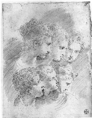
Donato Creti (?), Zwei männliche und vier weibliche Köpfe, Feder in Tusche, auf weissem Papier, 25,7 x 20,4 cm, Kunstmuseum Bern, Graphische Sammlung, Inv. A 2010.19.

Die Bernerin Sophie von Fischer vom Baumgarten (1820–1890) schenkte dem bernischen Kantonal-Kunstverein 1878 einen Klebeband mit 101 Zeichnungen. Der Verein übergab das Konvolut ein Jahr später dem neu eröffneten Kunstmuseum in Bern. Die Blätter wurden 1980 aus konservatorischen Gründen aus dem Band herausgelöst und inventarisiert. Die Zeichnungen enthalten hauptsächlich einzelne oder mehrere Darstellungen von Männer-, Frauen-, Kinder- und Puttenköpfen. Sachverständige zogen die Zuschreibung an Bologneser Künstler des 18. Jahrhunderts entgegen auch hinsichtlich des inhaltlichen Schwerpunktes und der Provenienz des Klebebandes. Für die vorliegende Untersuchung stellte sich die Verfasserin die Frage, ob es sich bei den Zeichnungen um Originalwerke Bologneser Künstler, um Übungsblätter ihrer Schüler oder gar um Fälschungen handelte. Insgesamt konnten