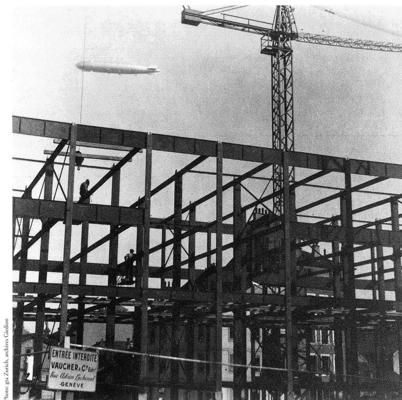
L'immeuble «Clarté» en chantier. – Le dirigeable Zeppelin survole Genève, sans doute à l'occasion de la venue, le 2 juillet 1931, du professeur Auguste Piccard, invité par l'Aéro-Club suisse.

Die Hinterglasmalerei stellt bis heute eine weitgehend unbeachtet gebliebene Technik der angewandten Kunst dar. Zahlreiche Werke sind ausserdem in einem dramatischen Erhaltungszustand, da die auf Glas gemalte Farbe leicht abzublättern beginnt.