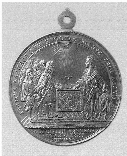
4 Medaille auf das Bündnis des französischen Königs Ludwig XIV. mit den Eidgenossen 1663, Gold, ohne Öse 55,6 mm, 112,74 g, Bernisches Historisches Museum, Inv. 88.666, Geschenk A. v. Ernst, Mst. 1:1. – Vorderseite: Büste des jungen Ludwig XIV. Rückseite: Beschwörung des Bündnisses in der Kathedrale Notre-Dame in Paris, welche in Medaillen, Gemälden und Gobelins verewigt wurde. Die eidgenössischen Gesandten erhielten als Erinnerungstück je eine goldene Medaille.