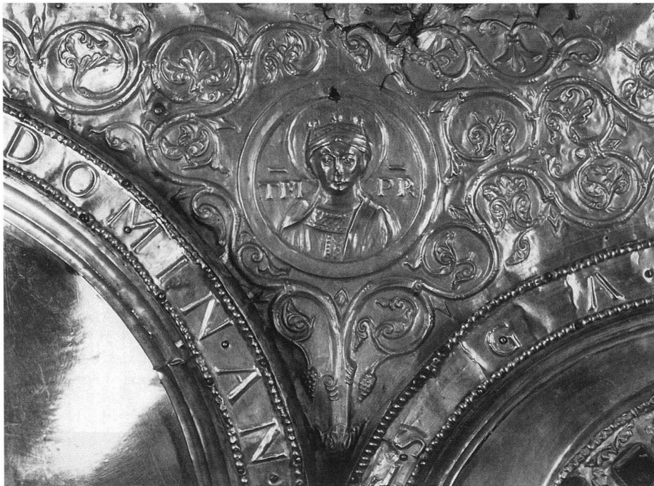
5 Tugendmedaillon. – Die im Mittelalter Herrschern zugeordneten Kardinal-Tugenden (Gerechtigkeit, Mass, Klugheit und Stärke), wurden auch ins Programm der Basler Tafel aufgenommen und als Medaillons in den Rankenteppich über den Arkadenbögen eingebettet. Zur Verbildlichung wählte man frontale, gekrönte Frauenbüsten mit Nimben und Beischriften. Die Buchstabenpaare «TM» und «PR» sind Abkürzungen für TEMPERANTIA (=Mässigkeit).

nach Bamberg. Zu dem anspruchsvollen Gründungsvorhaben des letzten Ottonen in Franken gehörte auch das 1020 geweihte Benediktinerkloster auf dem Michelsberg, das in mittelalterlichen Quellen gern als mons angelorum (Engelsberg) bezeichnet wird.