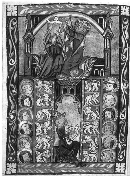
7 Die Krönung Mariens auf dem salomonischen Thron, Miniatur aus einem Psalter der Diözese Konstanz, um 1330, London, British Library, Ms. Add. 22279, fol. 15v. – Nach der christlich-typologischen Auslegung ist Salomon der Vorläufer Christi und Maria in übertragenem Sinn seine Mutter. Nach der jüdischen Auslegung sitzt Salomon auf dem Thron und deutet auf seine «Mutter», die Thora-Rolle (vgl. Abb. 8).