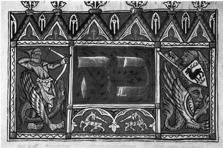
6 Hybriden-Figuren aus dem Pentateuch des Herzogs von Sussex, Bodenseeraum, ca. 1320, London, British Library, Ms. Add. 15282, fol. 314r. – Stilistisch leiten sich die Drachen und Mischwesen ebenfalls vom Graduale von St. Katharinenthal her.

hörnchen und Hahn, Falke und Taube (von unten nach oben, von rechts nach links).