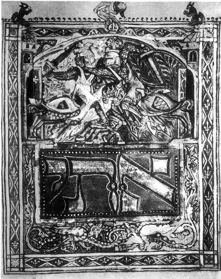
11 Ritterkampf, Miniatur aus dem 3-bändigen Machsor , Budapest, Library of the Hungarian Academy of Sciences, Kaufmann Collection, Ms. A384, fol. 103v. – Die Wappen der Kämpfer deuten auf die historische Schlacht bei Mühldorf vom 28. September 1322 zwischen Ludwig dem Bayer und Friedrich dem Schönen von Österreich.