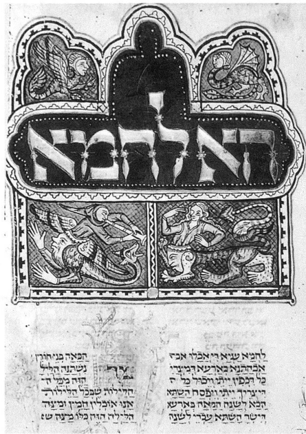
4 Hybriden-Figuren aus dem 3-bändigen Machsor , Budapest, Library of the Hungarian Academy of Sciences, Kaufmann Collection, Ms. A384, fol. 120r. – Die Besetzung der Tafeln mit Drachen und Tiergestalten ist Teil einer aschkenasischen Tradition, die in hebräischen Handschriften dieser Zeit verbreitet ist.