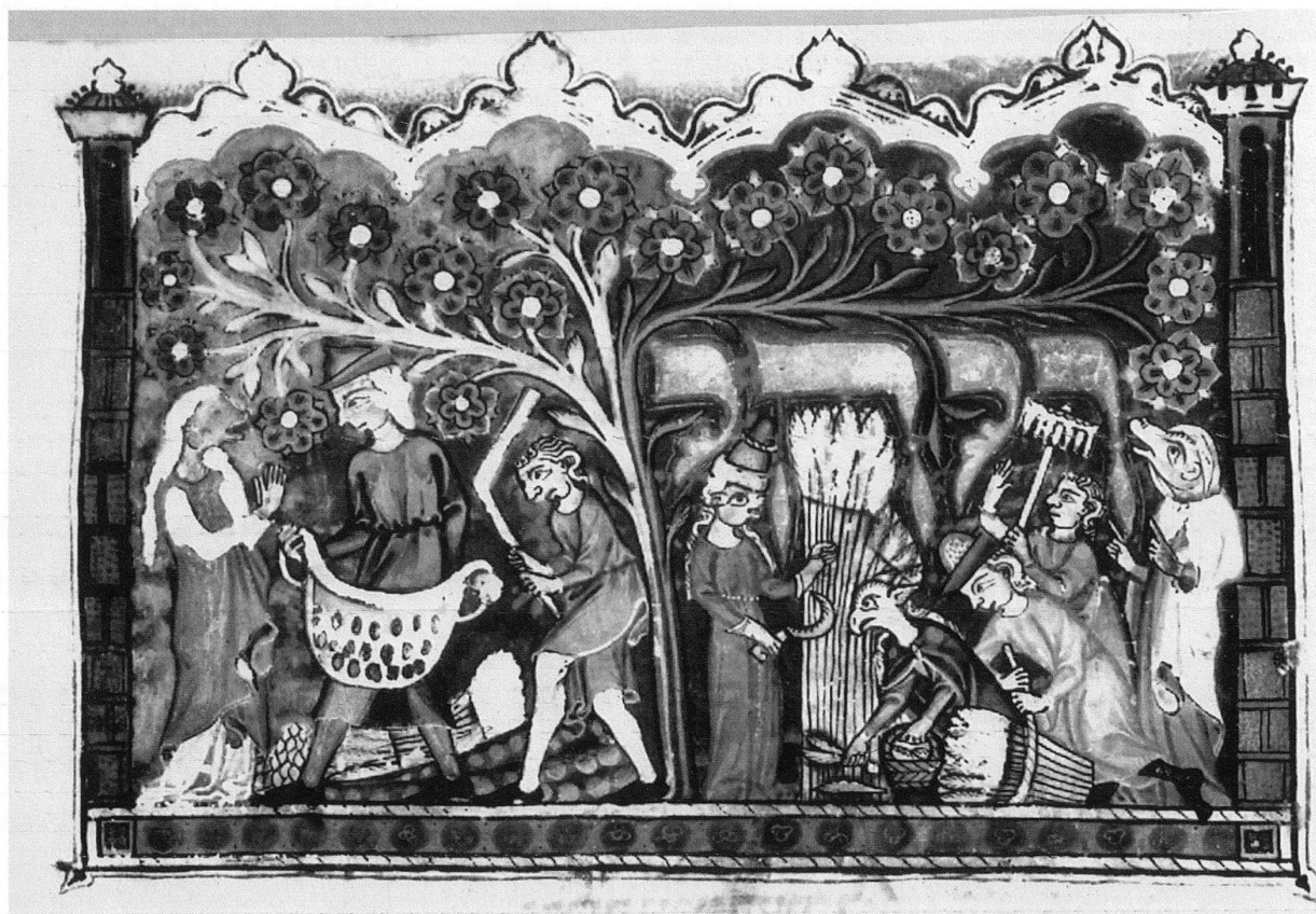
9 Szene aus dem Buch Ruth, Miniatur aus dem 3-bändigen Machsor , London, British Library, Ms. Add. 22413, fol. 71r. – Stilistisch und ikonographisch zeigen sich Beziehungen zu christlichen Handschriften: Die Gesichter im Profil sind denjenigen aus dem Graduale ähnlich (vgl. Abb. 2), die Figur der Schnitterin scheint aus der Manessischen Liederhandschrift übernommen zu sein (vgl. Abb. 10).

Die lokale Eigenart des jüdischen Machsor zeigt sich in der Adaption von Motiven profaner Herkunft ebenfalls, beispielsweise in der Miniatur des Buches Ruth (Abb. 9). Unter den Figuren dieser Illustration ragt eine Schnitterin hervor, die höchstwahrscheinlich Ruth selbst darstellt. Nach einem Midrasch, der in den Jüdischen Altertümern des Josefus Flavius erscheint, befiehlt Boas Ruth, die gerade auf seinem Feld Nachlese vollzieht, zu ernten, statt nur nachzulesen (5. Buch 9, 12). Die hier dargestellte Schnitterin trägt auffallend aristokratische Handschuhe, die in krassem Gegensatz zur Feldarbeit stehen, die sie ausübt. Eine ähnlich «aristokratische» Schnitterin findet sich in der Manessischen Liederhandschrift, die in mehreren Etappen zwischen 1300 und 1340 in Zürich geschaffen wurde (Abb. 10). 29 Die Schnitterin in der Liederhandschrift trägt, ähnlich wie die im Machsor , ein langes, rotes Gewand, ihr Haar quillt unter dem Hut hervor, und lange Handschuhe bedecken ihre Hände und Handgelenke. In ihrer linken Hand hält sie ein Ährenbüschel, in der rechten eine Sichel. In der Liederhandschrift ist sie keine Feldarbeiterin, sondern die Geliebte eines Ritters, die in dem mit dieser Miniatur geschmückten Lied erwähnt wird.