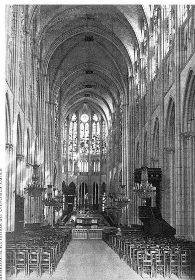
Innenansicht der Abteikirche von St. Denis auf einer Fotografie um 1900.