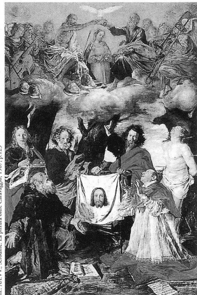
Ill. 1: AA.VV., Serodine. La pittura oltre Caravaggio, 1987, p.123

Sia la tela sia l'affresco rappresentano, al registro superiore, l'Incoronazione di Maria in un concerto angelico e, al registro infe-