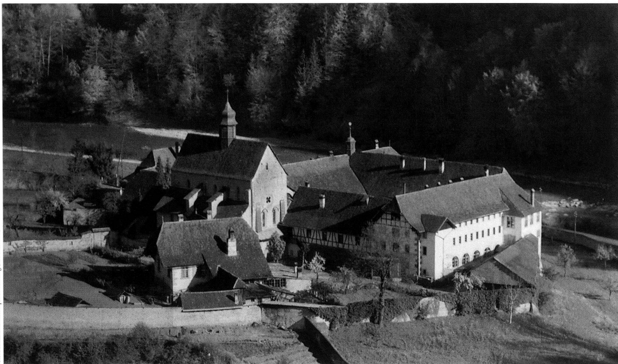
Zisterziensnerinnen-Kloster in der Magerau, Freiburg

CHF 40.– (TVA et frais d'expédition non comprises), une couverture encollée en tissu synthétique bleu foncé avec impression en gris-clair sur la couverture et sur la tranche. Nous vous prions de bien vouloir envoyer vos quatre numéros de la 51 e année 2000 au plus tard jusqu'au 15 janvier 2001 à l'adresse suivante: Imprimerie Stämpfli SA, case postale 8326, 3001 Berne . La livraison aura lieu vers la fin du mois de février 2001. La table des matières se trouve à la fin de ce présent numéro.