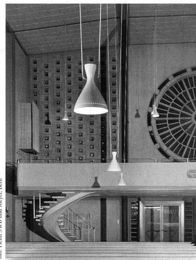
Kirche Bruder Klaus in Bern. – Der Kirchenraum, Blick zur Empore (Ausschnitt vor der Aufstellung der Orgel).

Monte Verità. Asconas Mountain of Truth , Mara Folini , 44 S., Serie 63, Nr. 628/629, CHF 10.–. – Asconas Monte Verità war seit Anfang des 20. Jahrhunderts Rückzugsort und Naturparadies für zivilisationskranke Kunstschaffende, Intellektuelle und Aussteiger, die sich dazu entschlossen hatten, ein natürlicheres und körperbewusstes Leben zu führen. Der Kunstführer gibt Einblick in die Lebensphilosophien der Beteiligten und beleuchtet schwerpunktartig die architektonische