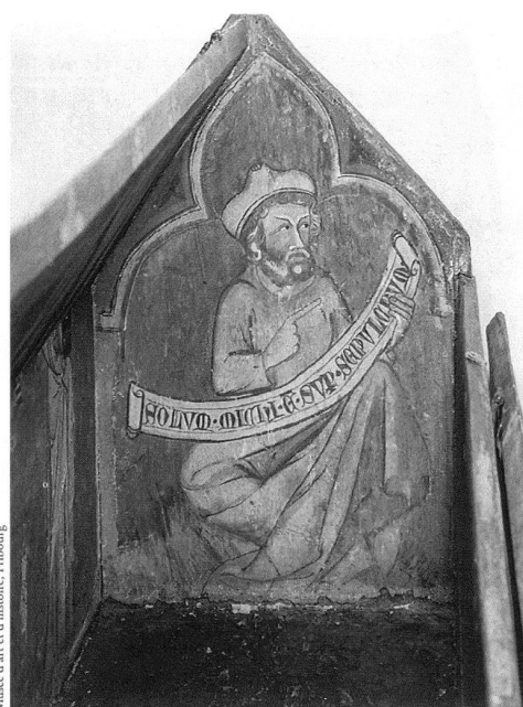
Musée d'art et d'histoire, Fribourg

4 Le saint sépulcre de la Maigrauge, vers 1345–1360, la statue du Christ, sculptée en ronde bosse.