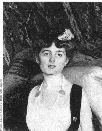
Edoardo Berta, Portait de femme, vers 1898 , huile sur carton sur bois, 60×48 cm, Museo Civico di Belle Arti Lugano.

Après sa mort, l'historiographie d'art a progressivement entouré de silence cette figure qui avait pourtant occupé une place non négligeable au sein de la réalité artistique nationale. Berta a partagé ce sort avec un grand nombre d'artistes suisses de sa génération qui, comme lui, ne se sont pas engagés résolument sur la voie de la peinture moderne. Comme lui, ces artistes avaient cependant bénéficié du soutien de