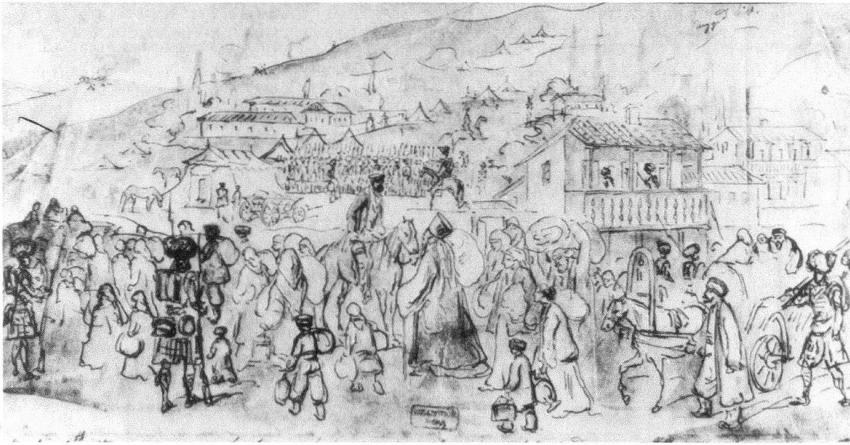
Constantin Guys, Exode de la population grèque de Balaklava (1854), collection particulière, France. – Ce dessin a servi de modèle pour une illustration dans The Illustrated London News .