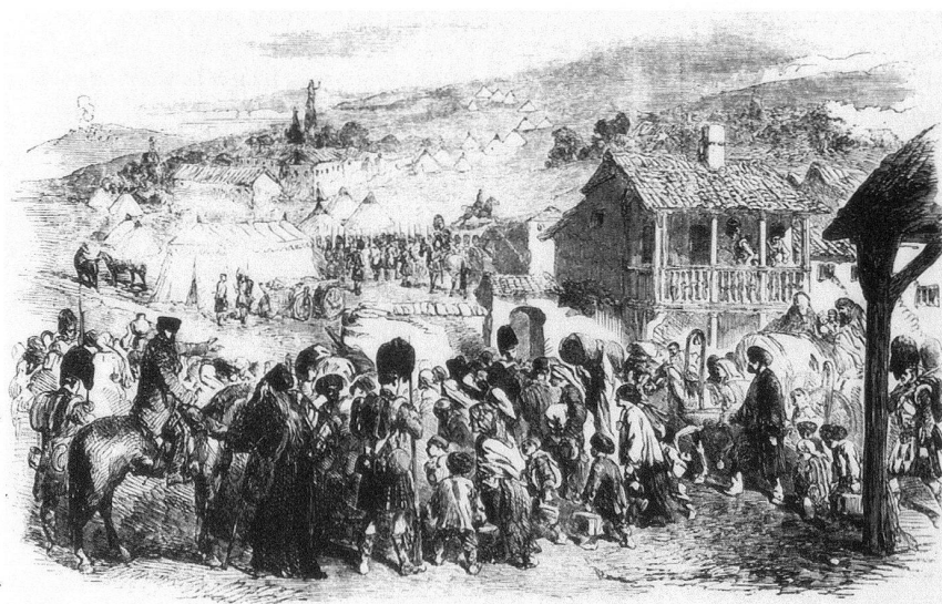
Exode de la population de Balaklava , in: The Illustrated London News , 4 novembre 1854. – L'illustration est en majeure partie une copie du dessin de Guys.

Ce faisant, Baudelaire a créé un mythe qui devait avoir la vie longue et, à la longue, empêcher que l'on apprécie Guys à sa juste valeur. Ce mythe est celui du «talent d'un homme inconnu et plein de génie». 3 De fait, que son «génie» prête encore de nos jours à conjecture et que l'homme soit demeuré pour le moins méconnu, cela est fonction de cette gloire par procuration. Sans doute, le personnage, qui s'était volontairement résolu à l'incognito, y est pour beaucoup. Tous les exégètes concordent sur ce point: Guys est «un peintre secret» 4 , dans le meilleur des cas un artiste «obscurément glorieux» 5 , «connu comme le grand inconnu, sur l'identité duquel on ne peut que spéculer» 6 . Geffroy écrit: «Quand la mort de Guys fut annoncée par l'article de Nadar, ce fut comme une révélation de sa vie. Il n'en est guère d'autres, – que son œuvre.» 7 Or, l'entendement de cette œuvre ne saurait passer par cette survie qu'à la suite de Baudelaire, à l'occasion de la première exposition posthume en 1895, devait