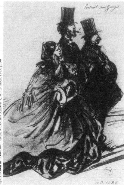
Constantin Guys, Guys (à droite) avec Madame et Monsieur Nadar , Musée Carnavalet, Paris.

L'anecdote, quoique centenaire, n'a rien perdu de sa valeur heuristique. Au regard de l'historiographe, elle désigne cet état de fait auquel doit souscrire toute étude attachée à la figure de Constantin Guys, en ce que, inéluctablement, elle ne le voit et ne le conçoit qu'à travers les yeux de Baudelaire. C'est même devenu une formule consacrée – exprimant l'embarras d'avoir à discourir à la suite du poète – que de rendre hommage à son analyse «si pénétrante, si complète, si définitive» 2 . On comprend que sa critique artistique puisse jeter un éclairage avantageux sur les motivations de Baudelaire relativement à Guys; en aucun cas, cependant, elle ne doit subroger à l'exercice de la critique d'art. Car si, comme commentaire, elle nous est un précieux auxiliaire, c'est davantage pour sa propre compréhension esthétique que pour l'analyse de l'œuvre qu'elle nous présente sous une lumière aveuglante en proportion. Je ne veux pas parler ici du caractère lacunaire de son témoignage – là n'est pas la question, du reste l'auteur nous apprend singulièrement peu sur la personne de l'artiste. Mais se doit d'être retenu son acharnement à vouloir symboliquement élever un croqueur au rang de peintre, et qui plus est celui de la modernité.