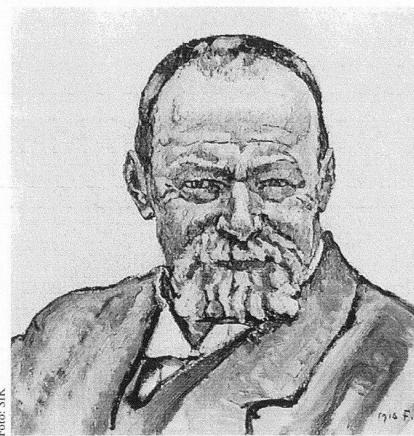
Ferdinand Hodler, Selbstbildnis, 1916, Öl auf Leinwand, 39 × 40,5 cm, Aargauer Kunsthaus Aarau.

Hodler ist aktuell. Zahlreiche Ausstellungen im In- und Ausland sowie Höchstpreise auf Auktionen haben in jüngster Zeit den Blick der Fachwelt und des kunstinteressierten Publikums auf diesen wichtigen Pionier der Schweizer Moderne gelenkt. So wird die Realisierung eines bislang fehlenden wissenschaftlichen Werkkatalogs der Gemälde Hodlers umso dringender und sinnvoller. Das Schweizerische Institut für Kunstwissenschaft, ein von staatlicher und privater Seite unterstütztes Forschungsinstitut, erarbeitet gegenwärtig gemeinsam mit namhaften Spezialisten den Œuvre-katalog der Gemälde Hodlers und bittet deshalb alle Besitzerinnen und Besitzer von Werken dieses Künstlers um Kontaktaufnahme: Schweizerisches Institut für Kunstwissenschaft, Paul Müller, Zollikerstrasse 32, 8032 Zürich, Tel. 01 388 51 51, Fax 01 381 52 50, oder Institut suisse pour l'étude de l'art, Antenne romande, Université de Lausanne, BFSH 2, 1015 Lausanne, Tel. 021 692 30 96, Fax 021 692 30 95, E-Mail hodler@sikart.ch. Ebenso von grossem Interesse sind in diesem Zusammenhang Fotografien, Briefe und Dokumente aller Art. Diskretion wird zugesichert.