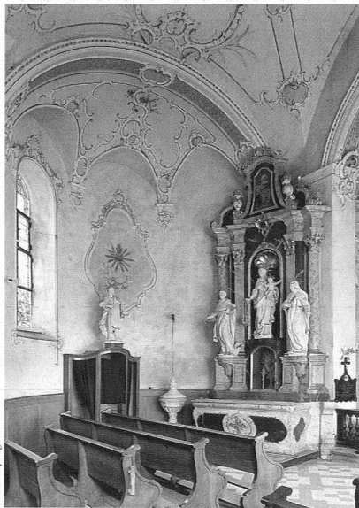
Hohenrain, Pfarrkirche St. Johannes Baptista (ehem. Kommendekirche), Marienaltar, Aufnahme 1968 vor der Zurückrestaurierung.

Er ist einer der wichtigsten Förderer des Neubarock als Kirchenbaustil in der Schweiz. Seit 1894 setzte er sich dafür ein, die sich ausschliesslich am Mittelalter orientierenden Stilanlehnungen im Kirchenbau aufzubrechen. In der Schweiz machen zwischen 1900 und 1915 die neubarocken Kirchenbauten der von Kuhn geförderten