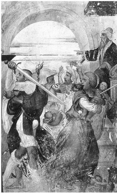
Maggia, Santa Maria delle Grazie in Campagna, affresco della parete meridionale: La strage degli Inocenti (prima dei restauri).

Il secondo frescante, detto anche il Maestro delle Storie di Anna e Gioachino e autore del registro superiore della parete sud, non fornisce aspetti stilistici di particolare rilievo; si tratta di un artista del luogo che imita, senza troppo successo, il Maestro dell'abside. Tuttavia egli dimostra una grande conoscenza dei Vangeli Apocrifi ed una grande sensibilità nei confronti della popolazione valmaggese; propone infatti una narrazione chiara, lineare e ricca di dettagli che legano intimamente i dodici riquadri agli ambienti vallerani della sua epoca.