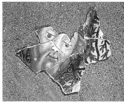
Die Beschneidung Christi (Detail), Freskenfragmente aus der Pfarrkirche Santi Nazario e Celso, Airola.

Nach der Grabung bestand der erste Arbeitsgang darin, das Material zu sichten. Um weitere Brüche und Kratzer zu vermeiden und um einen Überblick zu gewinnen, mussten alle Fragmente nebeneinander ausgebreitet und vom Staub befreit werden. Eine erste Grobsortierung erfolgte nach eindeutig figürlicher Malerei und verschiedenen Farbgruppen. Danach wurde eine differenzierte Einteilung vorgenommen, und es liess sich spontan eine ganze Anzahl Fragmente Bruch auf Bruch zusammenfügen. Diese wurden fotografisch dokumentiert, so dass mit Hilfe von Fotomon-