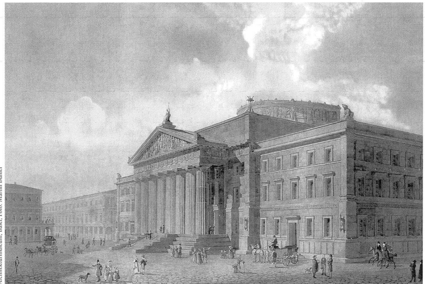
Architekturmuseum, Basel; Foto: Martin Buhler

Die Ausstellung und die begleitende Monografie möchten dazu beitragen, die Bedeutung des Baumeisters Berri hervor zu heben, der den Vergleich mit dem damaligen europäischen Umfeld keineswegs zu scheuen braucht. Originale Pläne und Studien Berri bilden den Kern der Ausstellung, ergänzt mit heutigen Arbeiten des Fotografen Serge Hasenböhler. pd/RB