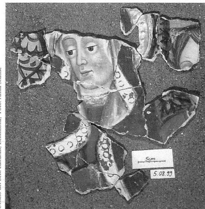
Die Beschneidung Christi (Detail), Freskenfragmente aus der Pfarrkirche Santi Nazario e Celso, Airola.