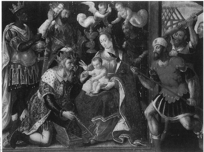
Repro. S. 310 Anonymer Meister, Ikonoklastische Szene mit einer Anbetung der Könige, Öl auf Holz, 104×140 cm, Flandern, Ende 16. Jh., Musée de la Chartreuse, Douai. – Für die Katholiken ist der Bildersturm ein Sakrileg gegen Gott, die Gottesmutter oder die Heiligen.

Dieses ehrgeizige Ziel erforderte eine umfassende Visualisierung sowohl der unendlich vielfältigen Funktionen von Bildern aller Art in vorreformatorischer Zeit als auch der Folgen der Bilderfeindlichkeit in der protestantischen Kirche. Wie die Ausstellung ist auch der Katalog thematisch aufgebaut. Die Einordnung der 234 Exponate erfolgt deshalb nicht nach rein chronologischen oder kunsthistorischen Kriterien, sie werden vielmehr in ihren ursprünglichen Sinnzusammenhang gestellt und sachkundig kommentiert. So vermitteln sie oft überraschende Einsichten in die Hintergründe des Bilderkults und seiner Verwerfung, wie dies meines Wissens noch nie in einer Ausstellung versucht worden ist. Die Erklärungen zeugen im Allgemeinen von grosser Sensibilität, die allerdings in der heutigen bildbesessenen Zeit und bei schwindender konfessioneller Verkrampfung leichter zu gewinnen ist als ehemals. Umso störender wirkt dann der trendige Griff in die sexologische Mottenkiste zur Deutung der Christus-Johannes-Gruppen