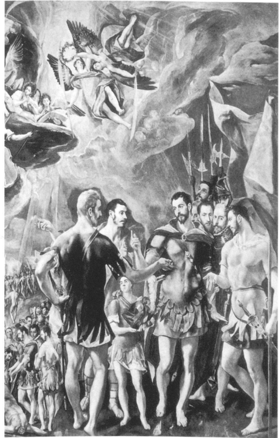
6 El Greco, Le martyre de saint Maurice et de la Légion Thébaine, 1580–82, huile sur toile, 448 × 301 cm, Monastère de l'Escorial, Madrid.