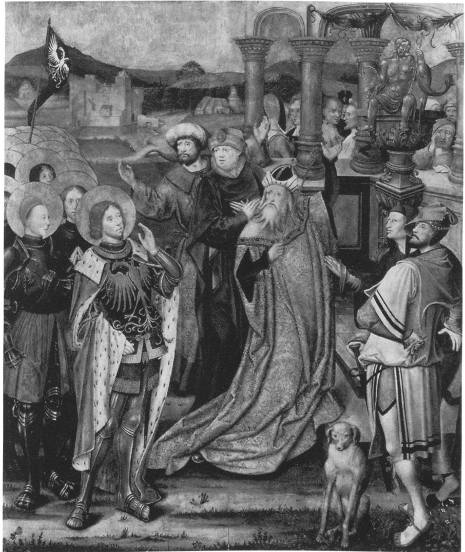
1 Maître de l'Autel de la Crucifixion de Munich, panneau intérieur gauche, Saint Maurice refuse de sacrifier aux idoles, 1517, peinture sur bois, 130 × 107 cm, Bayerische Staatsgemäldesammlungen, Alte Pinakothek, Munich.

son forfait d'une mort ignominieuse. Bien des années après le massacre, les restes des soldats furent révélés , c'est-à-dire retrouvés, par Théodore, qui fit construire une basilique ( basilica ) adossée au rocher d'Agaune pour recueillir les ossements des martyrs. Les pèlerins vinrent en nombre sur le tombeau, et des miracles se produisirent. Eucher en mentionne deux: la conversion d'un ouvrier païen travaillant à la construction de la basilique et la guérison d'une paralytique. Au terme de la Passio , il est précisé que la fête du martyre est célébrée le 22 septembre. Dans la missive jointe à son récit, Eucher prend soin d'ajouter qu'il tient ses informations d'Isaac, évêque de Genève, qui les aurait lui-même reçues de Théodore, évêque d'Octodure à la fin du IV e siècle.