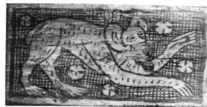
Basel, Schönes Haus, Erdgeschoss, Balkenmalereien, Ausschnitt: Wildschwein. (Sabine Sommerer, 2001)