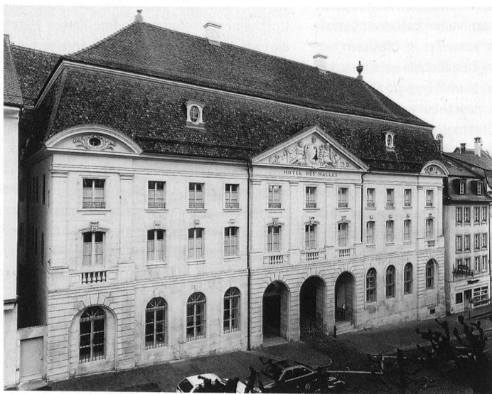
Porrentruy, Hôtel des Halles par Pierre-François Paris, 1766–1769, façade principale. (République et Canton du Jura, Office du patrimoine historique, Porrentruy; photo: Jacques Bêlat)

Les années 1750–1760 témoignent d'un encouragement éclairé aux arts, issu de la philosophie des Lumières. En étroite contact avec le royaume de France, la cour de Porrentruy entre naturellement dans la sphère culturelle française, bien que toujours rattachée au Saint-Empire. De plus, on y dénote un vif désir de luxe et d'apparat en une période de grande prospérité économique. Cependant, le faste de Porren-