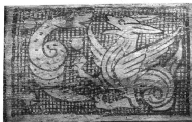
Basel, Schönes Haus, Erdgeschoss, Balkenmalereien, Ausschnitt: Drache und Schlange. (Sabine Sommerer, 2001)