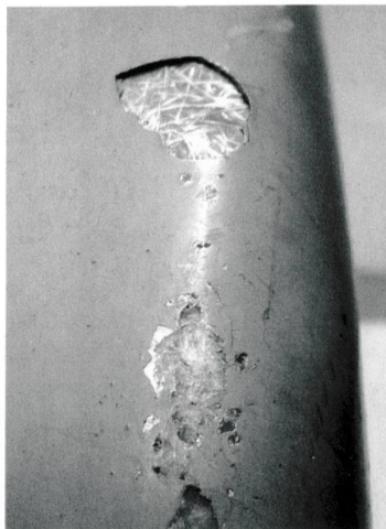
Schadensbild am Panton-Chair.