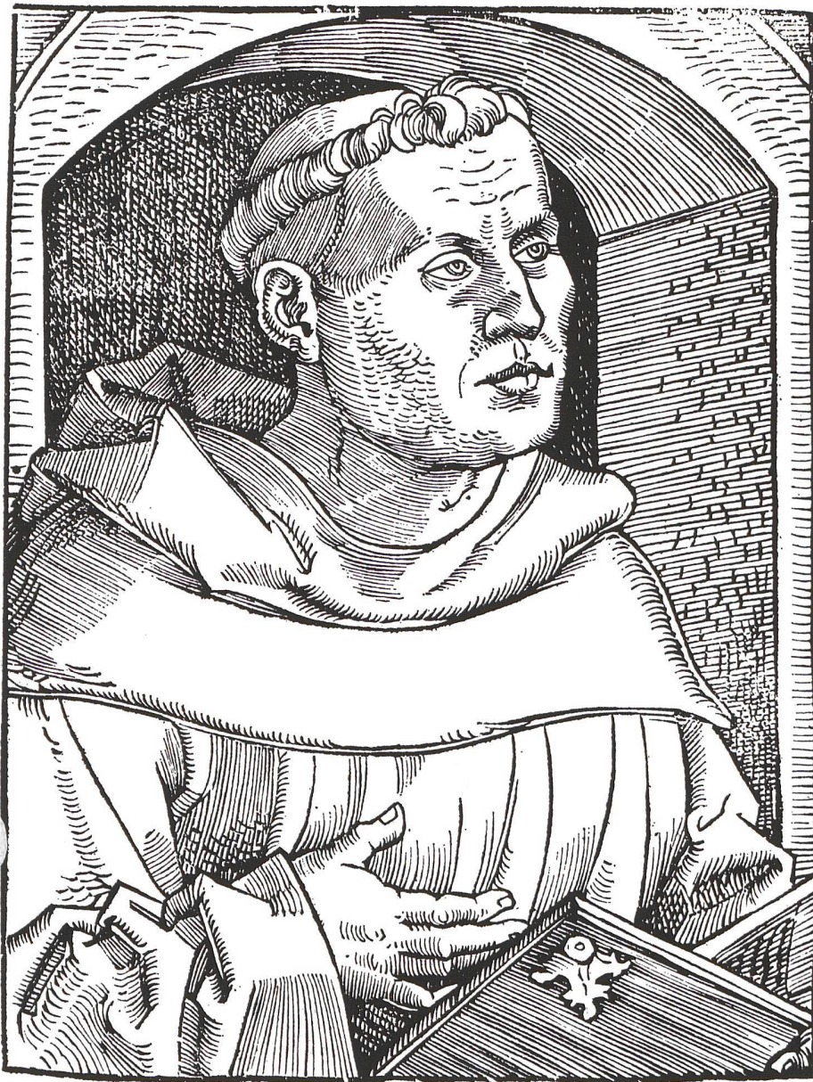
1 Hans Baldung Grien, Martin Luther devant une niche, 1520, gravure sur bois, 15,4 × 11,6 cm, Universitätsbibliothek, Bâle.

dit. D'autre part, dès 1520, imprimeurs et artistes vont très rapidement adopter les idées nouvelles, pour des raisons qui ont trop souvent été réduites à des intérêts financiers certes manifestes, la réimpression massive des œuvres de Luther, puis l'édition des innombrables pamphlets des «années de tempête» de la Réforme, jusqu'en 1525, ayant été aussi l'occasion d'un formidable «boom» éditorial. Cependant il est aussi évident que ce milieu, qui pourrait être qualifié, de façon anachronique, d'avant-gardiste, était prêt intellectuellement à accueillir avec enthousiasme le nouveau message.