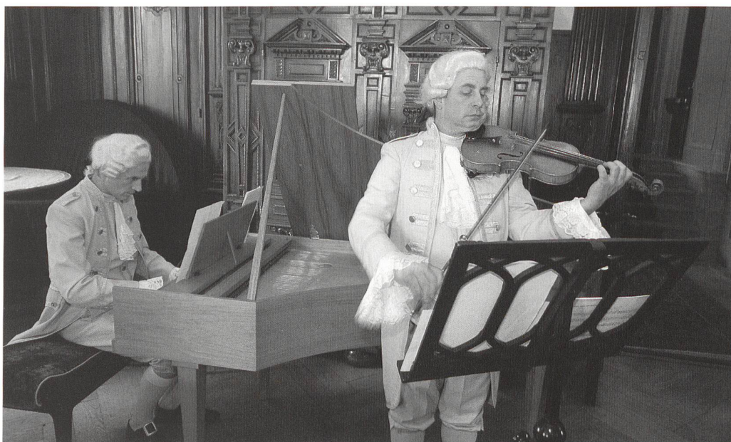
Nach der Jahresversammlung: Szene aus der Vergangenheit in Schloss Meggenhorn.

Wie immer oblag der Stelle Öffentlichkeitsarbeit auch die Presseinformation für sämtliche übrigen Publikationen und Veranstaltungen des Jahres (2 Kunstdenkmäler -Bände, 15 Schweizerische Kunstführer GSK , 4 Ausgaben Kunst + Architektur in der Schweiz inklusive Veranstaltungsprogramm, Sonderbroschüren Veranstaltungen im Jubiläumsjahr und Weiteres). Dazu kam die Verantwortung für die Herausgabe und den Vertrieb der weiteren Kommunikationsmit-