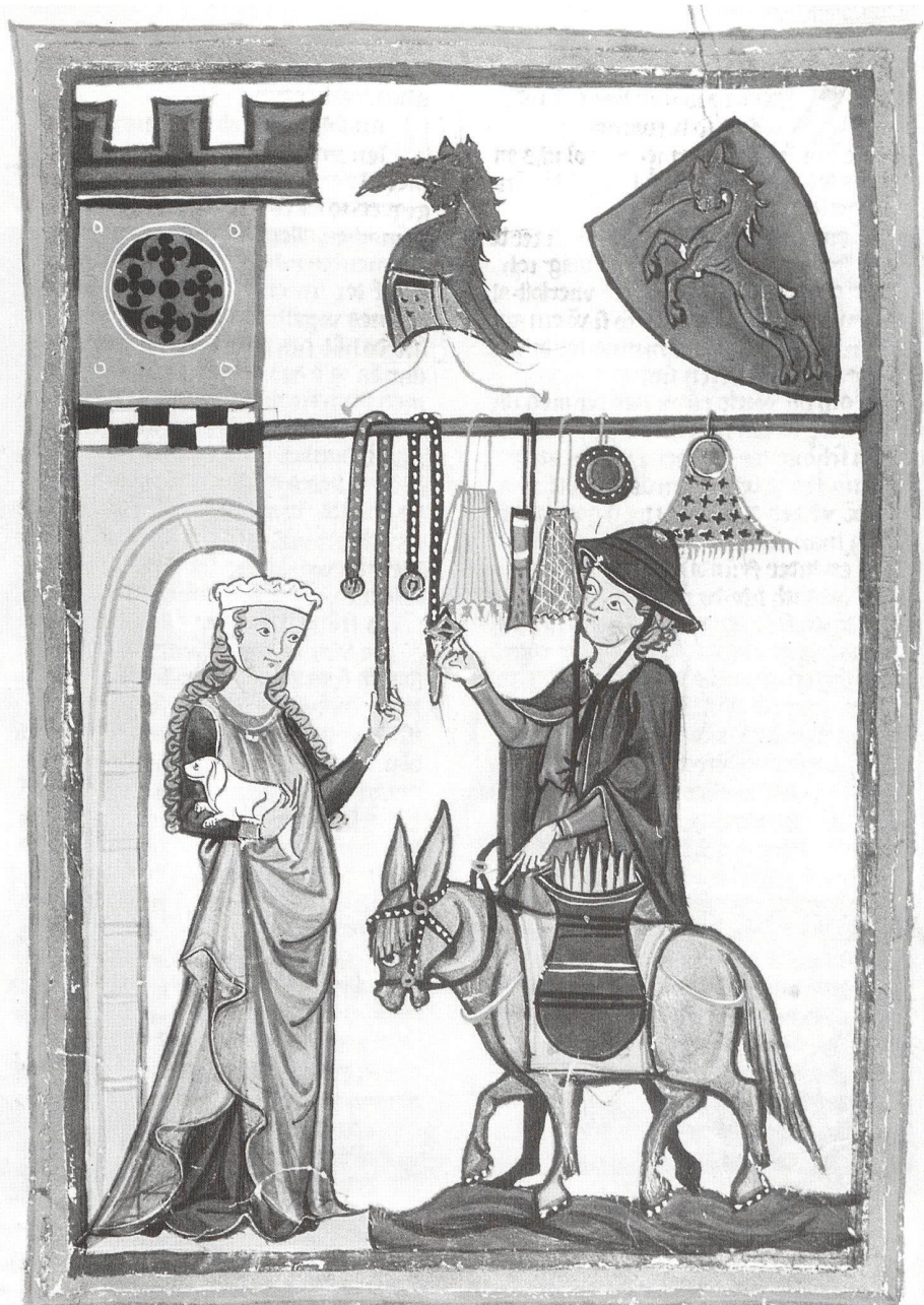
1 Herr Dietmar von Ast, 35,5 × 25 cm, Grosse Heidelberger Lieder- handschrift (Codex Manesse), Zürich 1305–1340, Universitätsbibliothek Heidelberg, Cod. Pal. germ. 848, fol. 64r. – Dietmar von Ast hat sich als Händler verkleidet und bietet der Dame seines Herzens – gekleidet in Cotte, Surkot und Gebende – Beutel und Taschen an.