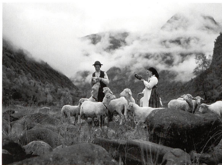
Schäferszene im Herbst im Verzascatal.

5. September 2007 bis 7. Juni 2009, Di-So 10-17 Uhr. Historisches und Völkerkundemuseum, Museumstrasse 50, 9000 St. Gallen, Tel. 071 242 06 42, www.hmsg.ch