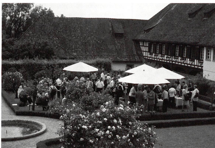
Jahresversammlung 2007 in der Kartause Ittingen, Stehlunch im Barockgarten. (GSK)