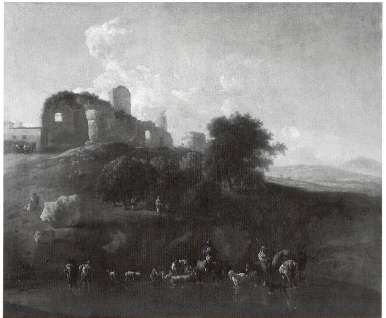
1 Karel Dujardin, Paysage, sans date, huile sur toile, 60 × 74 cm, Musée d'art et d'histoire, Neuchâtel.

tures et soixante-dix dessins constitueront chacun des deux premiers volumes (XVI e -XIX e siècles; XX e -XXI e siècles); un troisième sera consacré à la riche collection d'estampes, un quatrième à la sculpture. C'est au corpus du premier volume, dont la parution est prévue en 2009, que se consacrent les étudiants avancés en histoire de l'art depuis octobre 2005.