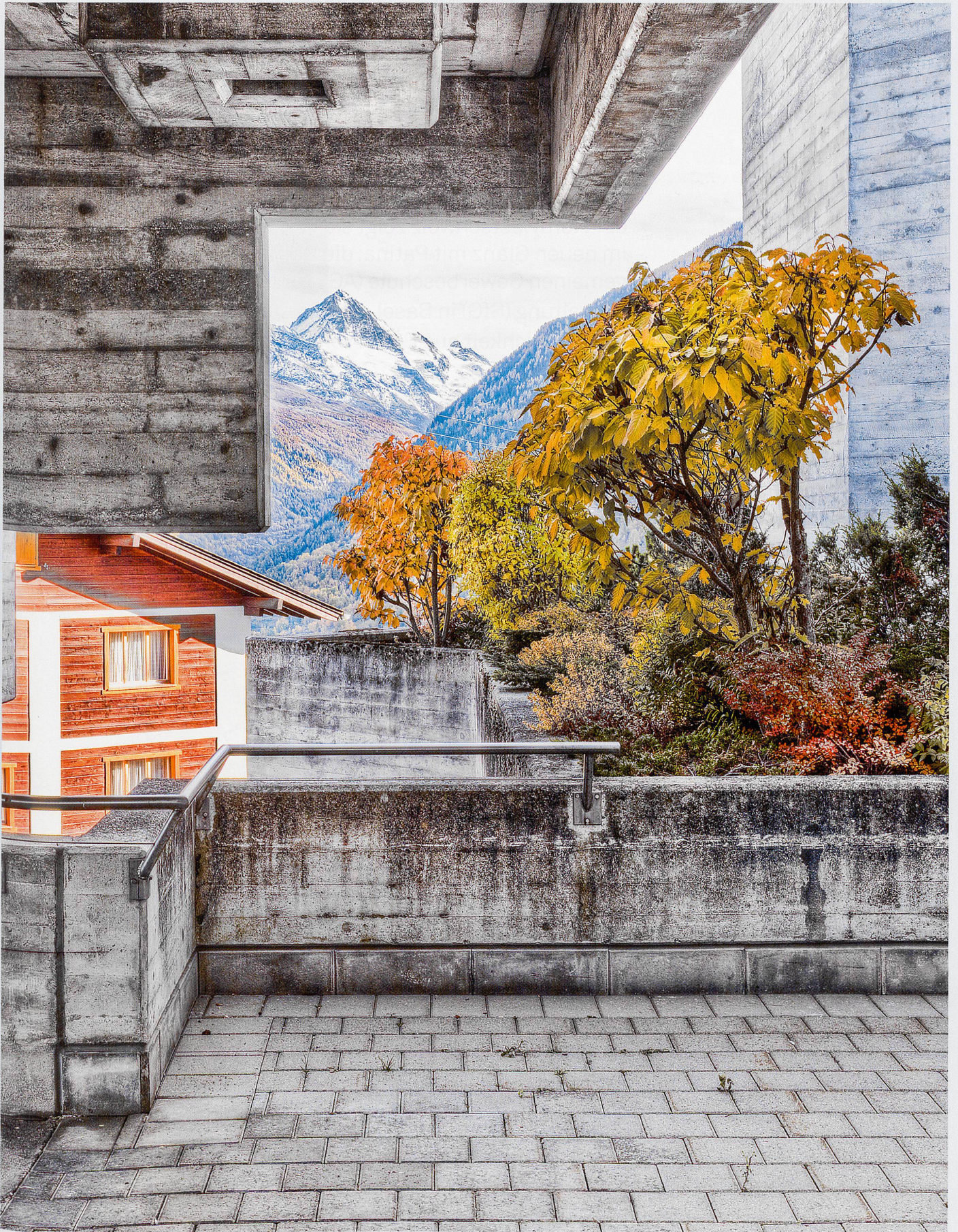
Beton in der Berglandschaft: Hérémece, Herbst 2009