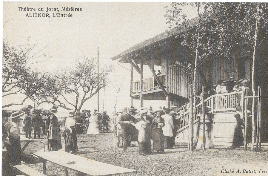
Le Théâtre du Jorat: public affluant à une représentation de la pièce «Aliénor», créée en 1910