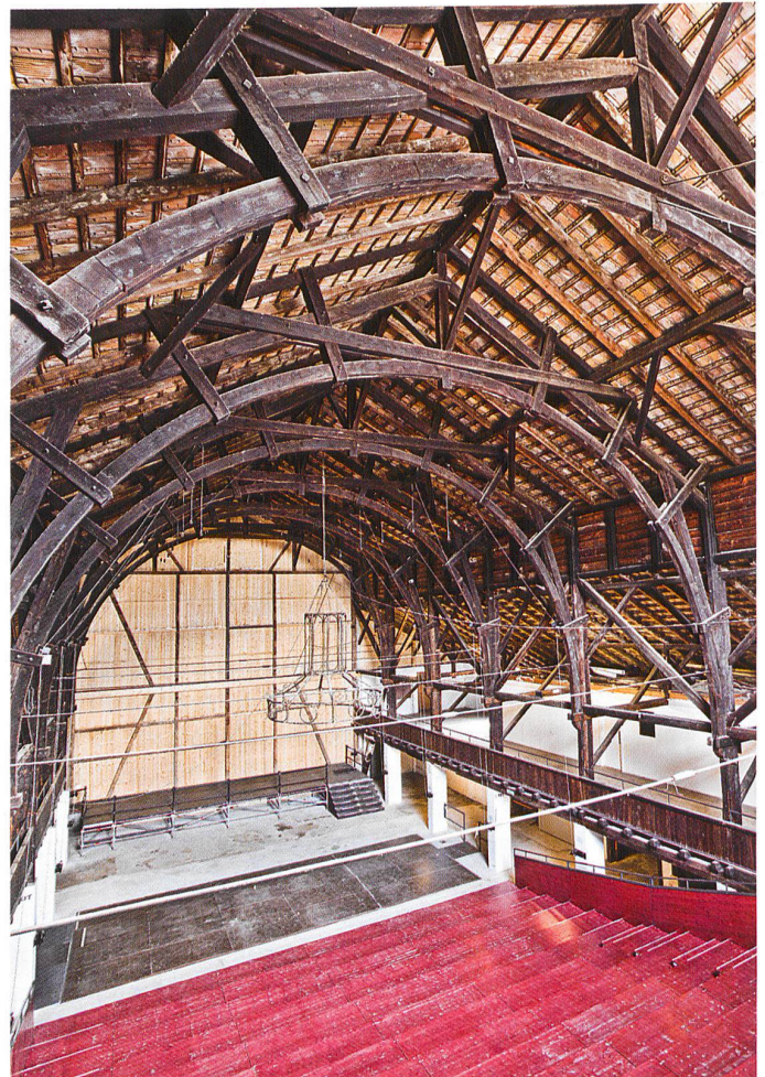
La salle et ses nouveaux aménagements scéniques: au premier plan, les gradins démontables; au sol, le plancher amovible recouvrant la fosse d'orchestre dans laquelle sont rangés les éléments de la scène

Markthalle, Kirche, Scheune: Mit dem Grundriss einer Basilika, den weiten Dachflächen und seinen beiden von Zeltedächern bedeckten Türmchen weckt der Schiessstand von Moutier verschiedenste Assoziationen.