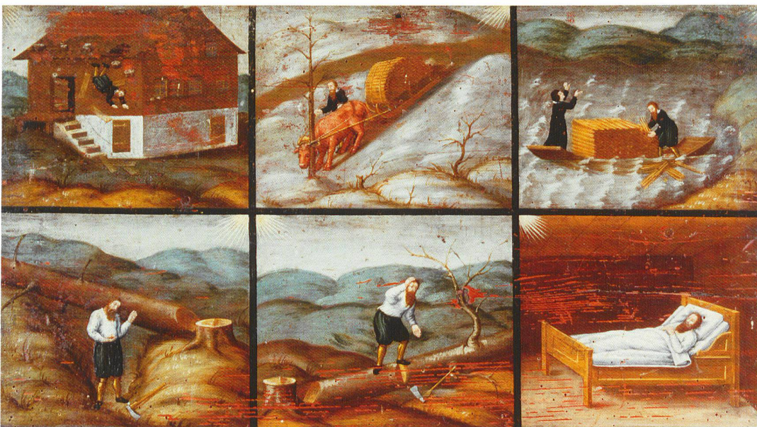
Szenen zu Dachdecken, Holztransport und Holzschlag auf einem Votivbild von 1660.