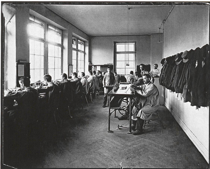
Uhrenherstellung bei IWC: um 1900 im Atelier

Arbeitskräfte zu finden hoffte, ein industrieller Revolutionär. Er hatte bereits führende Bostoner Uhrenfirmen wie die American Waltham Watch Company oder die E. Howard Watch & Clock Company als leitender Mitarbeiter von innen kennengelernt. Sein Plan war es, in der Schweiz Qualitätsuhrwerke bauen und diese dann in Nordamerika in Gehäuse einschalen und über eine New Yorker Absatzorganisation vertreiben zu lassen. Oder verglichen mit der Situation der Schweiz hätte New York die Rolle von Genf und die Schweiz die des günstig produzierenden Hinterlandes gespielt. Denn die Schweiz war damals tatsächlich ein Billiglohnland.