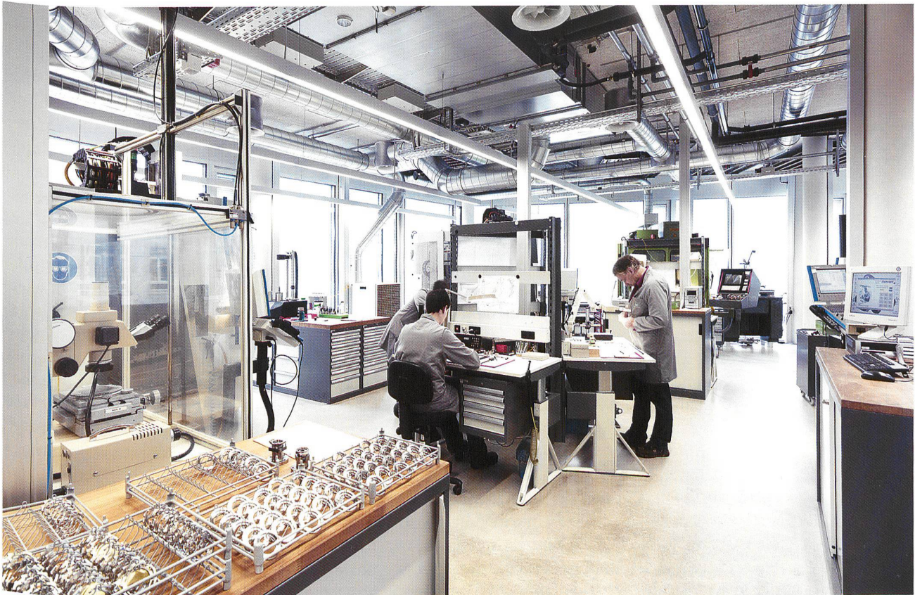
Uhrenherstellung bei IWC: im Jahr 2010