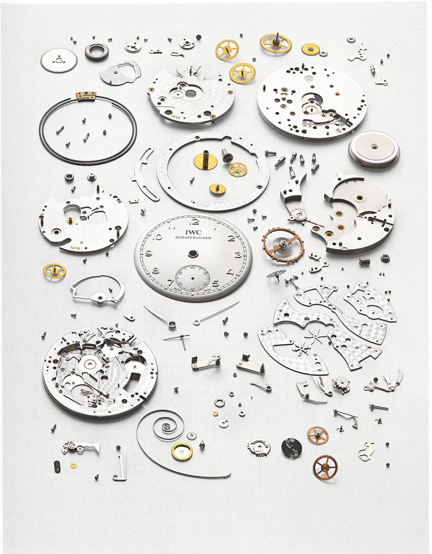
Uhrmacherkunstwerk: die Teile einer «Portugieser Minutenrepetition»