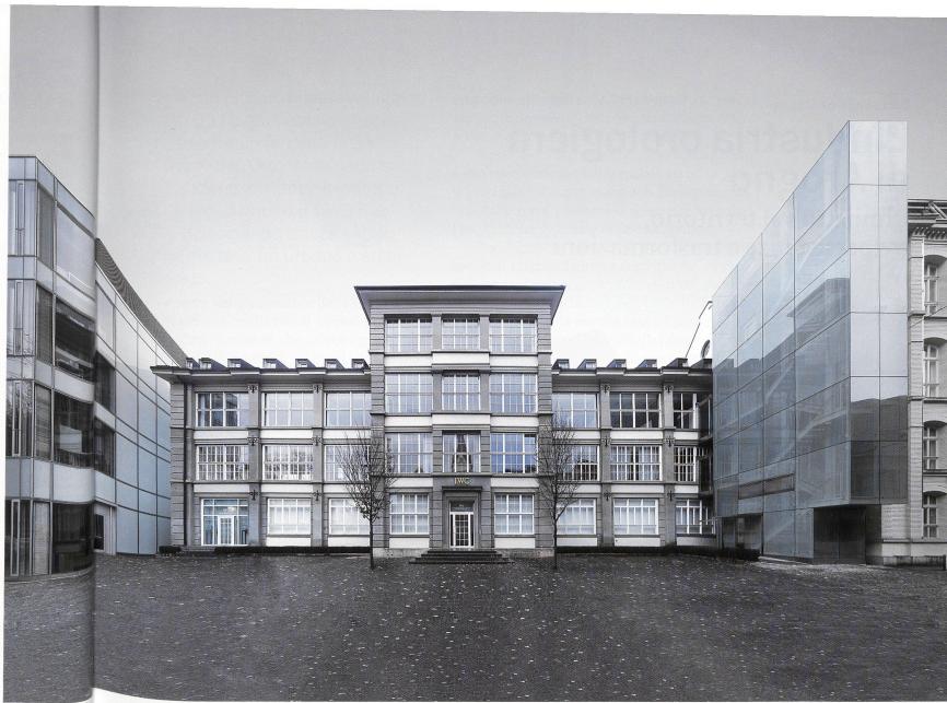
IWC-Stammhaus von Johann Gottfried Meyer (1875 erbaut), von funktionalen und innovativen Neubauten umgeben

Bereits 1993 erhielt das Stammhaus ein kleines Museum 4 . In Zusammenhang mit dem 2007 von Smolenicky & Partner (Zürich) umgebauten IWC-Museum wurde die äusserste Fensterachse des Ostflügels durch einen weiteren Eingangsbereich aufgebrochen, welcher nun direkt in die Boutique führt. Durch den ebenfalls neu gestalteten Haupteingang, bei dem durch statische Eingriffe die ehemals