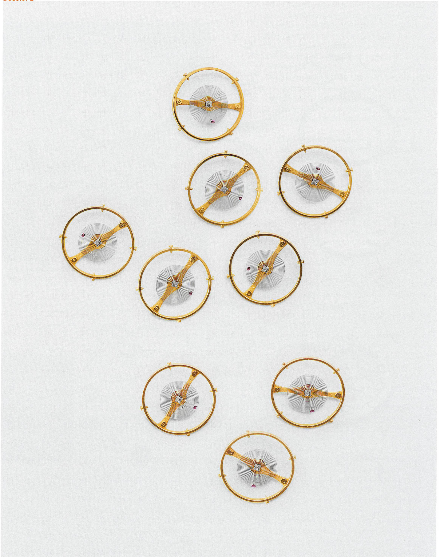
Die Breguet-Spirale: erfunden von einem der bedeutendsten Uhrmacher in der Geschichte der Zeitmessung, Abraham-Louis Breguet (1747–1823). Sie verbesserte die Wirkungsweise der «Unruhespirale» entscheidend und trägt zur Präzision der Zeitmessung bei