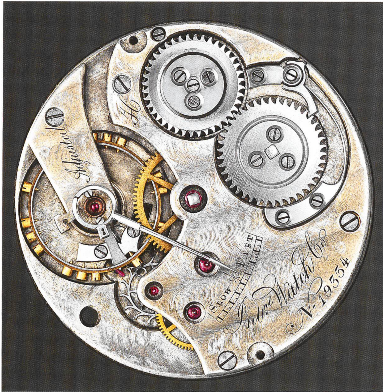
Die Ästhetik des Uhrwerks: Kaliber-Jones-Uhr der höchsten Qualitätsstufe «H» und Taschenuhr mit Goldfassung (unten)

vorzubringen. Das Sein, hier: Qualität, Genialität und Langlebigkeit der Werke, war bei IWC immer wichtiger als das Scheinen, wichtiger als Dekoration oder übertriebene Extrovertiertheit der Produkte, die häufig die «Genfer Uhr» auszeichnete. Das macht IWC-Uhren so eigenständig und unverwechselbar. Bis heute. Um dieses Ziel erreichen zu können, war es auch unverzichtbar, den eigenen Uhrmachernachwuchs heranzuziehen. Die hauseigene, vierjährige Ausbildung zum «Horloger complet» ist in der Branche hoch angesehen, die Absolventen sind entsprechend begehrt.