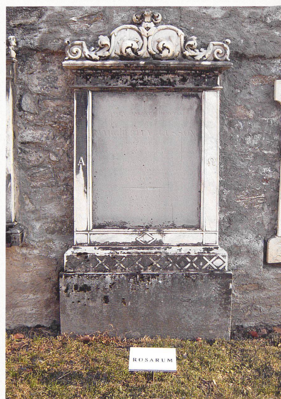
Cimitero di Rossura (vedi p. 30-31)

Direi che come minimo ha suscitato curiosità e ha indirizzato gli sguardi su una parte del cimitero a cui prima non si prestava molta attenzione. Da lontano la disposizione lineare delle tavolette crea l'effetto di una sottolinea-