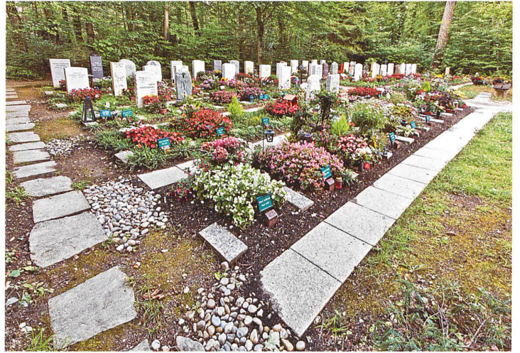
Feld von Urnengräbern. Die in Reihen angelegten Einzelgräber werden nach zeitlicher Abfolge der Todesfälle angeordnet. Das Grab wird durch die Stadtgärtnerei mit einer einheitlichen Bepflanzung eingefasst, die nicht entfernt oder beschädigt werden darf. Für die individuelle Grabbepflanzung steht eine Fläche von 100 × 50 cm zur Verfügung

Während diese Gräber trotz ihres individuellen Charakters alle dem Waldcharakter untergeordnet bleiben, wurden für die Gemeinschaftsgräber grössere Flächen ausgegrenzt. Dazu gehört beispielsweise die Grabstätte zur Erinnerung ▶