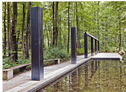
Urnengrabstätte von Brigitte Stadler und Hans Gut (1989). Die Bestattung findet bei diesem Gemeinschaftsgrab im angrenzenden Wald statt, wo die verrottbare Urne beigesetzt wird. Die Namen der Verstorbenen werden auf die Bodenplatten neben den grossen Wasserflächen eingraviert. Kränze und Blumen können oberhalb der Schriftplatten aufgestellt werden