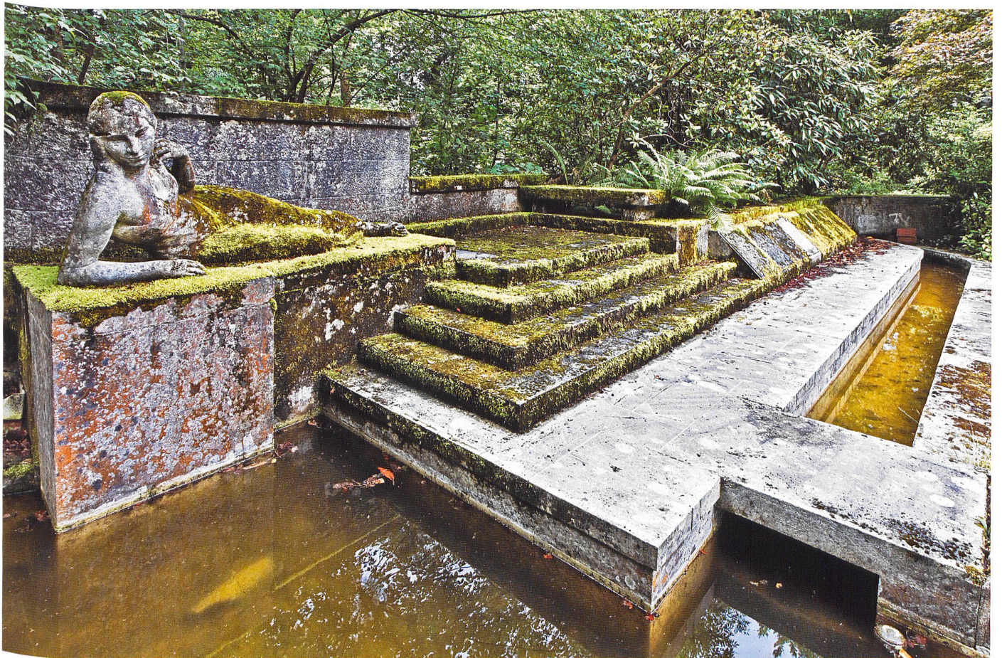
Grabstätte der Familie Fischli. Die 1935 vom Schaffhauser Bildhauer Walter Knecht geschaffene Figur, eine halblagernde mächtige Frauengestalt, wird von einem Wasserbecken umgeben