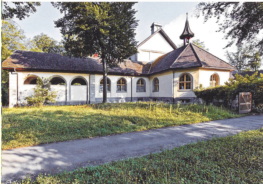
Das von Carl Werner 1913/14 im Heimatstil errichtete Friedhofshauptgebäude. Blick von Norden auf den kapellenartigen Anbau des Krematoriums, eine der frühesten Feuerbestattungsanlagen in der Schweiz; daran schliesst sich das nach vorn offen gestaltete Kolumbarium (Urnenhalle) des östlichen Nebentrakts an