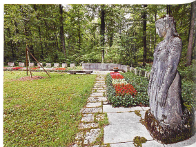
Grabstätte für die Bombardierungopfer von 1944. Die vom Zürcher Bildhauer Franz Fischer geschaffene kniende Frauenfigur blickt zu den in einem Halbkreis angeordneten Einzelgräbern – eine «würdige und pietätvolle Ruhestätte», wie der Stadtrat es 1944 in der Ausschreibung wünschte

Der Waldfriedhof ist das bewusste Gegenstück zum geometrisch, künstlich angelegten Parkfriedhof. Im Unterschied zu diesem wird der Waldfriedhof auch als spezifischer Ort der Verstorbenen wahrgenommen. Der Parkfriedhof dagegen ist multifunktional und soll gleichzeitig der Erholung dienen. Die Idee des Waldfried-