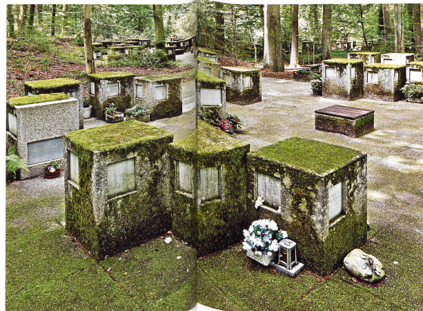
Urnennischenanlage (1971/76/84). Die in Gruppen zusammengefassten Betonkuben mit Einzel- und Doppelnischen besitzen eine einheitliche Beschriftung, persönliche Gedenkeichen sind nicht möglich. Für eine individuelle Bepflanzung stehen Eternitkisten zur Verfügung, auch können eine Schale oder ein Blumenstrauss neben dem Grab platziert werden