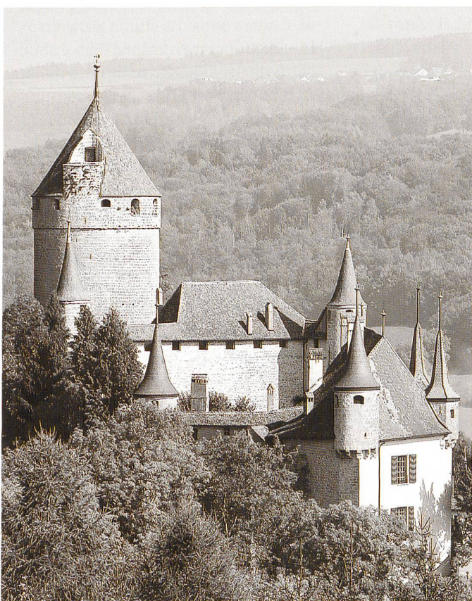
Château de Lucens