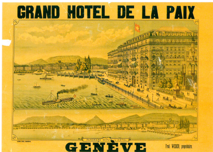
Fig. 1 Linden, Grand Hôtel de la Paix, Genève, vers 1890

Les lieux d'affichage sont une des clés de leur réussite: destinées aux voyageurs, ces publicités doivent attirer leur regard. Elles sont donc apposées dans les endroits où ils passent et attendent – moment où ils sont particulièrement réceptifs: halls de gares, agences de voyage, bureaux de poste, offices de tourisme, paquebots transatlantiques.