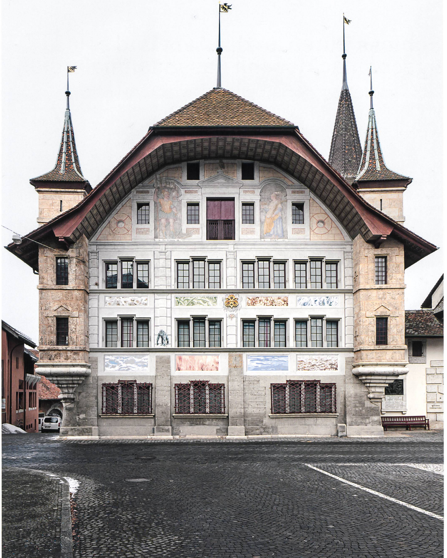
Hauptfassade des Schlosses Büren im heutigen Zustand, nach der Restaurierung 2003 und der Ausmalung der acht Bildfelder im Erdgeschoss und im 1. Stock 2006.