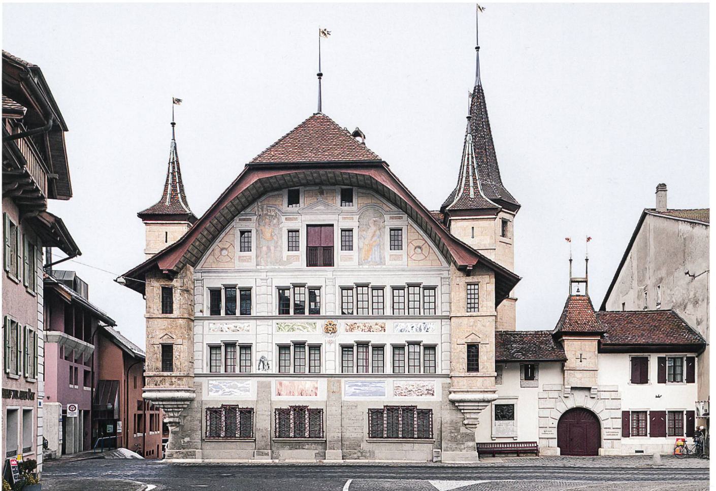
Die Hauptfassade mit dem «wehrhaften» Eingangsportal in den Schlosshof im Rahmen des Stadtraumes.

hielt Plepp das von ihm dekorierte Schloss in einem Ölgemälde und einem Kupferstich fest. 3 Die Reiterfigur des Marcus Curtius an der Westfassade blieb immer sichtbar, auch wenn sie im Laufe der Jahrhunderte mehrfach stark restauriert werden musste. Die Malereien an der Haupt-