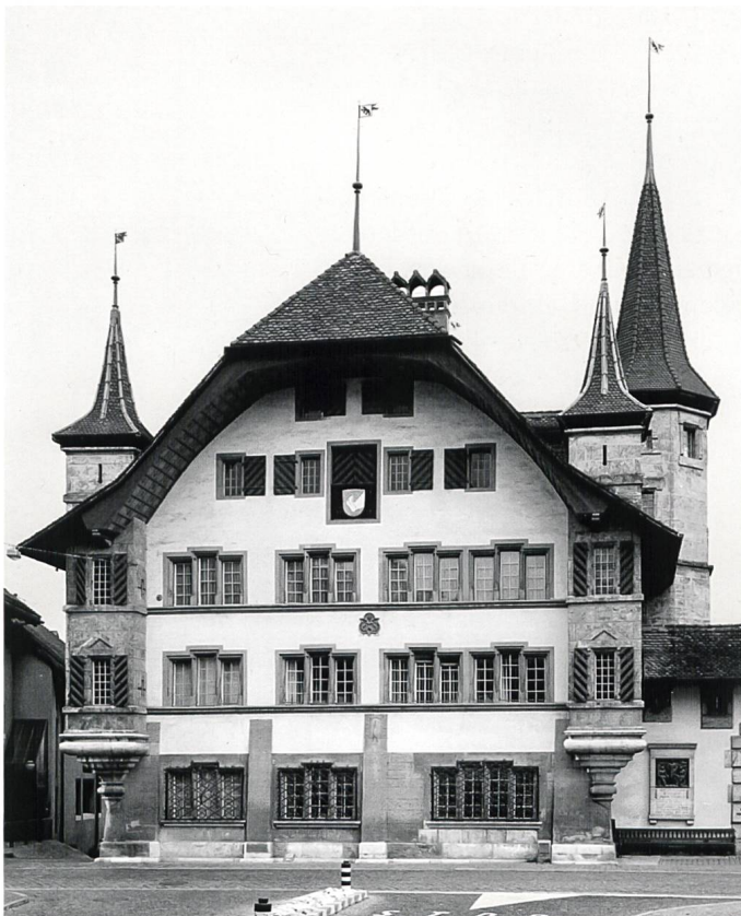
Die Hauptfassade nach der Renovation 1938