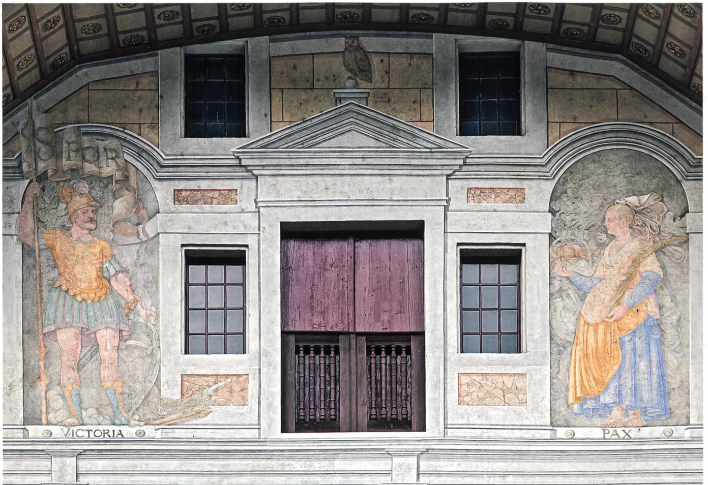
Marcus Curtius stürzt sich auf dem Forum Romanum in den Spalt, um Rom vor dem Untergang zu retten. Um diese Heldentat gebührend zu würdigen, fasste Plepp die Darstellung mit einem Triumphbogen ein.

Auf das Gesims im ersten Stock hatte Plepp ein angekettetes Äffchen gemalt, wie Hotz mit aller Präzision festgehalten hat. Weisenstein hat an seiner Stelle einen ungebundenen Gorilla gemalt und mit dieser provokativen Änderung dem Sinngehalt weitere, neue Züge zugefügt, auf die hier nicht eingetreten werden kann. Das Äffchen kann zwar durchaus als witzige Relativierung der hochtrabenden Anleihen an die römische und griechische Kulturgeschichte und als Symbol der Eitelkeit verstanden werden – Bern öffnet das alte Rom nach. Der Affe war jedoch im 16. und 17. Jahrhundert auch anders verstanden worden, nämlich als Symbol des Menschen, der die göttliche Ordnung und die göttlichen Fähigkeiten imitieren und nachvollziehen kann: Der Affe repräsentierte jene Eigenschaften des Men- ▶