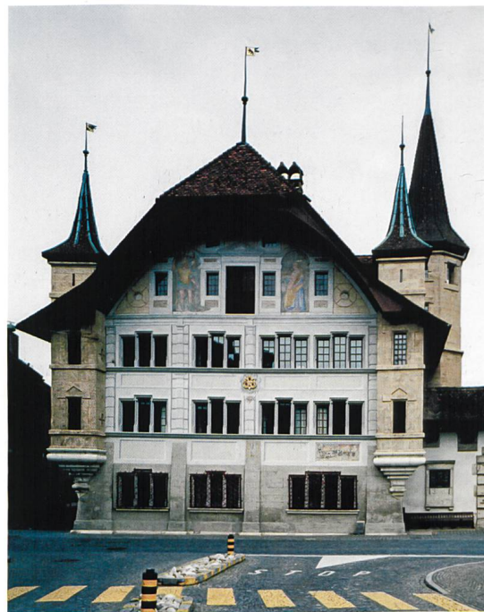
Zustand der Fassade im Herbst 2003 mit den leeren Bildfeldern

Nach der Restaurierung 2003 war nicht zu übersehen, dass die Fassade nicht im Gleichgewicht, sondern stark kopflastig war. Der gestalterisch, farblich und inhaltlich schwergewichtige Giebel war von schwachen Stützen getragen: Die leere Scheinarchitektur unter den Reihenfenstern bildete keine adäquate Basis, die formal hervorgehobenen Erker rahmten ein blindes Fassadenfeld ein. Das Gesamtbild der Fassade mit ihren acht leeren Feldern vermochte auch nach Auffassung der zuständigen Kommissionen und Ämter nicht zu überzeugen. Es stellte sich die Grundsatzfrage, ob die zeitgenössische Ergänzung eines fragmentarisch überlieferten Kunstwerks zu tolerieren, ja zu fordern sei. Mit einem Künstlerwettbewerb wollte man versuchen, die Fassade «formal und in Bezug auf das Programm» zu komplettieren, an der Darstellung der Elemente und Jahreszeiten hielt man fest. Falls keine befriedigende Lösung gefunden werden könnte, sollte freilich auf die Ausführung verzichtet werden. In der Überzeugung, dass Baudenkmäler zeitgemäss ergänzt werden dürfen, wenn die Intervention Qualität aufweist und sich einfügt, ging die Denkmalpflege das Wagnis der zeitgenössischen Komplettierung ein. Der Juryentscheid fiel zugunsten des Vorschlags von Mercurius Weisenstein aus, der vorsah, mit den Mitteln des Grafikprogramms «Photoshop» Ausschnitte aus Fotos zu bearbeiten und zu reduzieren und sie nicht als Inkjet-Drucke zu materiali-