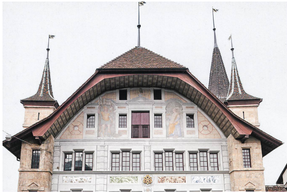
Teilansicht der Fassade mit dem Berner-Reichswappen im Zentrum.