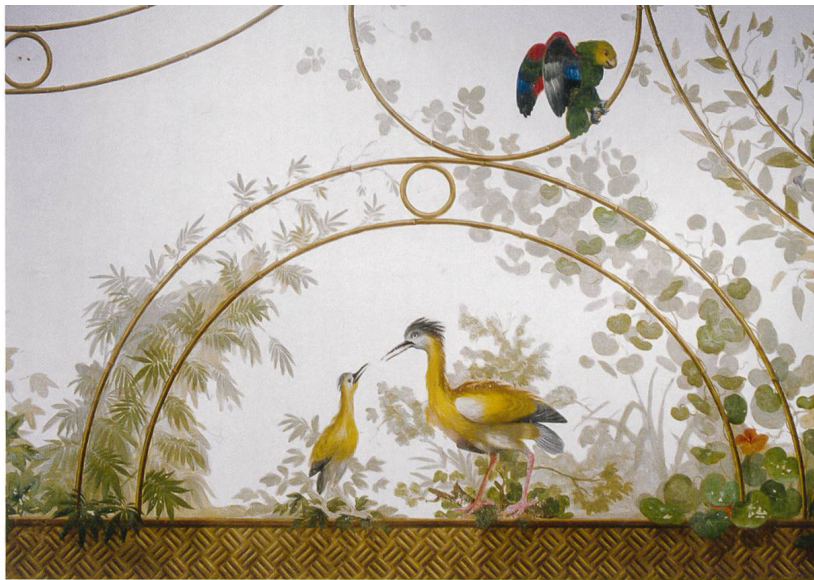
Dully, château. Niveau supérieur, salon ou salle à manger «volière». Détail du plafond peint

Il n'est donc pas surprenant qu'un tel pays de cocagne ait été parsemé d'imposantes demeures des XVI e , XVII e et XVIII e siècles, comprenant pressoirs, caves, logement du vigneron et résidence des maîtres. Le premier tiers du XIX e siècle a même suscité des palais comme l'extraordinaire villa cylindrique de La Gordanne, réduction du Panthéon de Rome à travers un modèle anglais, ou diverses villas néoclassiques (voire néogothiques pour les dépendances), inspirées de modèles internationaux. Combinant l'utile et l'agréable, ce patrimoine présente des éléments marquants non seulement dans les secteurs de l'architecture ou de l'art des jardins, mais aussi de l'ornementation gothique flamboyante, des panneaux sculptés Renaissance, des papiers peints de la fin du XVIII e siècle et autres décors peints ou sculptés laissés par des artistes de grande qualité. ●