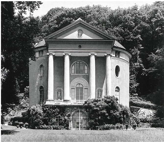
Perroy, La Gordanne, villa néopalladienne élevée vers 1803 selon un modèle anglais, faisant lui-même référence au Panthéon de Rome

château de Vincy qui appartient à la riche typologie des édifices entre cour et jardin.