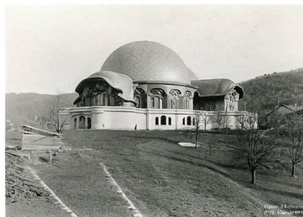
Dornach → 32