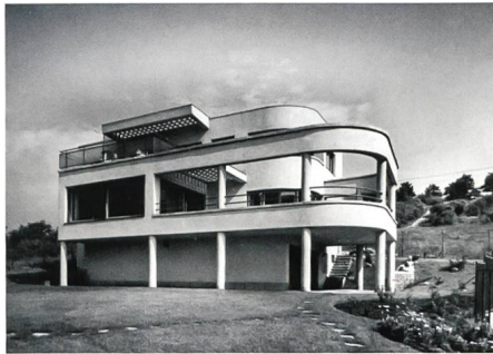
Budapest → 14