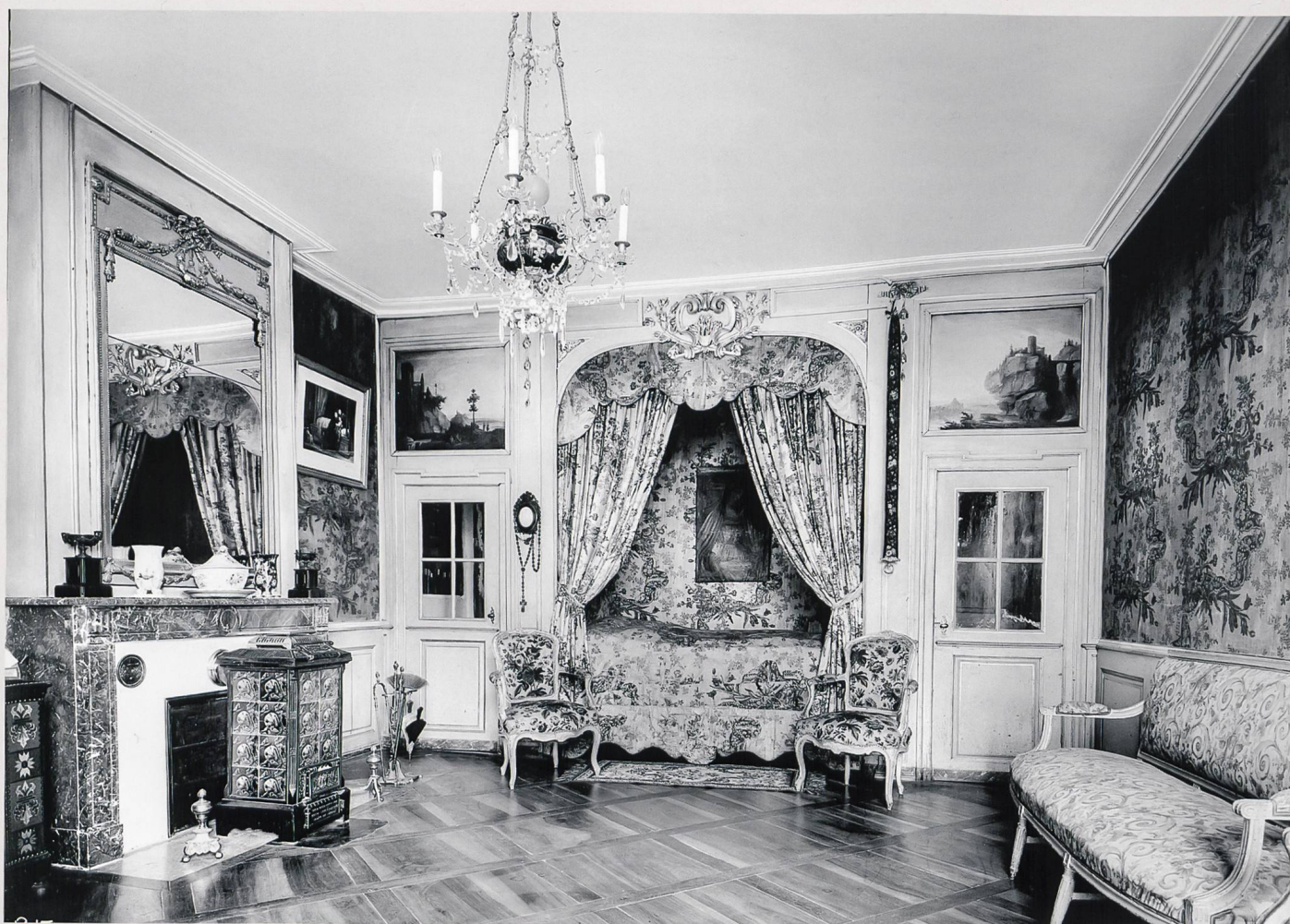
Solothurn, Sommerhaus Vigier, Stg. Bürgerhaus- archiv, vor 1929

In den 1970er Jahren begann man, gezielt Fotografennachlässe, sofern sie einen Schwerpunkt auf Architektur- und Orts-