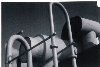
Le Corbusier. Images fixes (caméra 16 mm), 1936–1937.

symboliques et primordiaux, comme la voiture, qui, en plus de rendre compte de la présence de l'architecte sur place et donc de son contrôle du travail des photographes, offrent une intéressante interaction entre la voiture, machine moderne, et les édifices de Le Corbusier, pensés comme de véritables et fonctionnelles machines à habiter. L'œil de l'architecte corrige, précise et souvent impose la vision qu'avaient les photographes de son œuvre afin que les photographies révèlent sa perception propre.