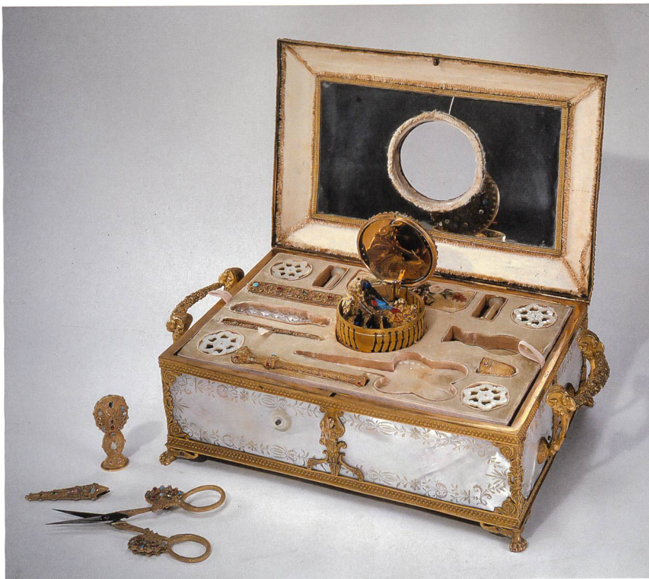
Nécessaire à couture à oiseau chanteur et musique attribuable à Rochat, début XIX e siècle. Or, vermeil, nacre.