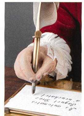
Détail de la main de l'écrivain de Jaquet-Droz et Leschet.