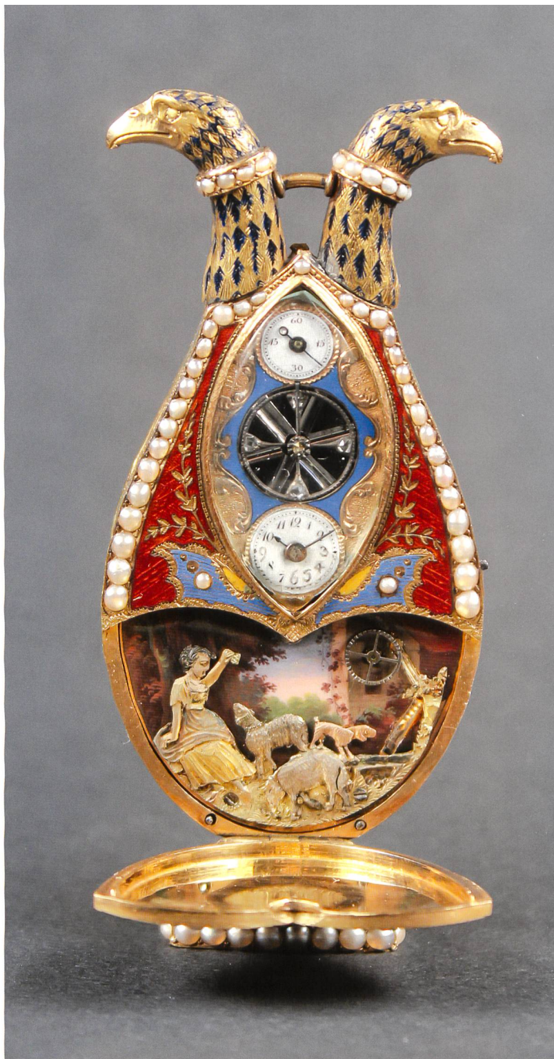
Pendulette lyre avec automate à musique. Pignet & Capt, entre 1795 et 1800, Genève. Or, émail, perles. H 72 mm, L 33 mm, E 13 mm.

On raconte ainsi la naissance de la vocation chez Jacques de Vaucanson que sa mère emmenait en visite tous les dimanches. L'enfant ►