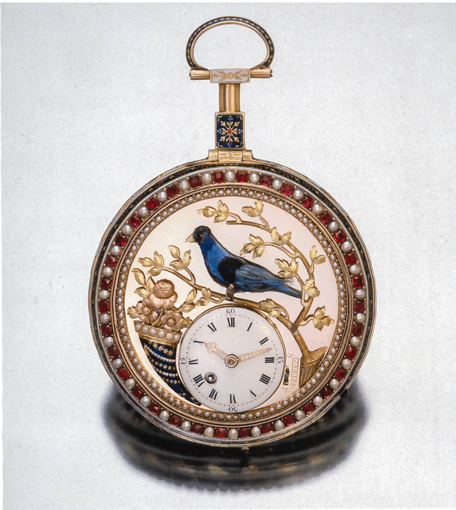
Montre à oiseau chanteur. Avec déclenchement à la demande du chant de l'oiseau attribué aux Jaquet-Droz et Leschot. Or, émail, rubis, perles.