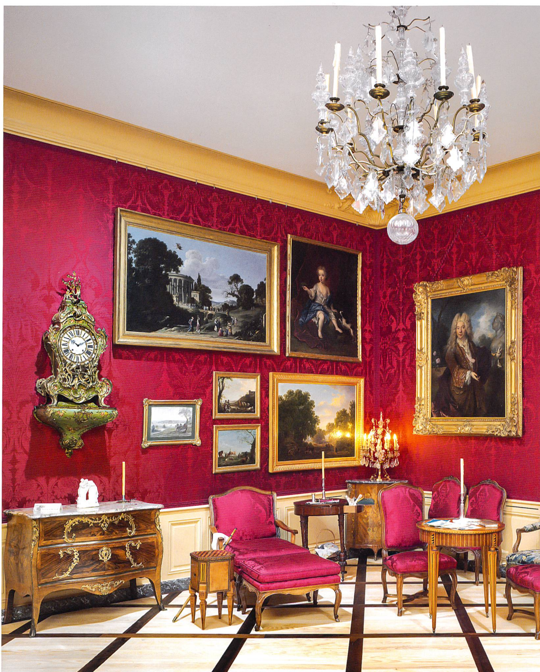
Fig. 9 Le salon avec sa tenture de damas cramoiisi et ses bas de lambris chamois

Si la reconstitution d'intérieurs est toujours perçue comme un exercice périlleux, c'est qu'elle interroge la notion de l'authenticité. Il importe dès lors d'être transparent, d'expliquer la démarche en disant clairement ce qui est original et ce qui ne l'est pas. Dans le cas présent, les nouvelles salles historiques du château de