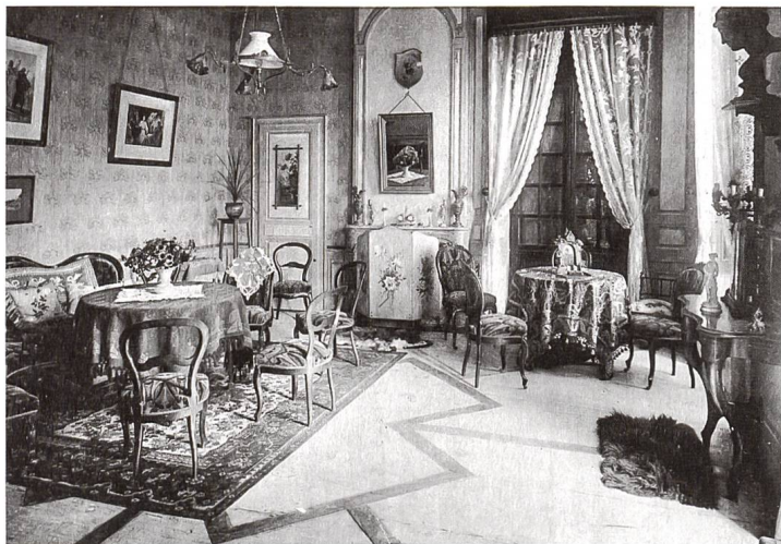
Fig. 3 L'ancienne bibliothèque transformée en salon, avec son parquet de sapin, sa cheminée de marbre et ses lambris, à l'époque où le château de Prangins abritait un pensionnat, 1913-1914. Photographie anonyme publiée dans l'album publicitaire Château de Prangins – Institution morale pour jeunes gens. Musée national suisse (LM 70895)