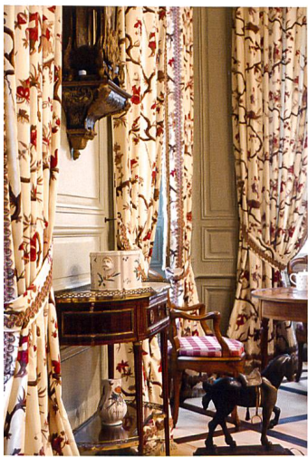
Fig. 8 Les rideaux à motif d'indienne rouge et blanc dans la petite salle à manger

Contrairement aux deux salles à manger, où les boiseries étaient privilégiées parce qu'elles ne retiennent pas les odeurs, le salon, appelé autrefois salle d'assemblée, ainsi que les deux bibliothèques étaient ornées de tentures. Sur la base des descriptions fournies par l'inventaire, nous avons cherché des tissus d'ameublement auprès d'entreprises hautement spécialisées, qui impriment ou tissent des étoffes d'après des modèles anciens et dont certaines ont reçu le label français d'Entreprise du Patrimoine Vivant.