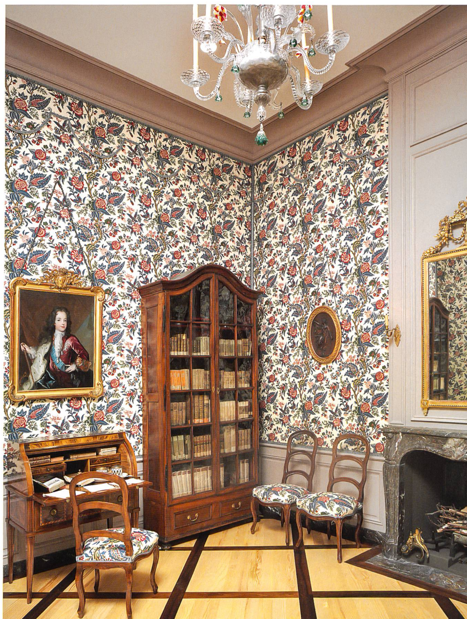
Fig. 6 La petite bibliothèque avec sa tenture d'indienne et son parquet bernois