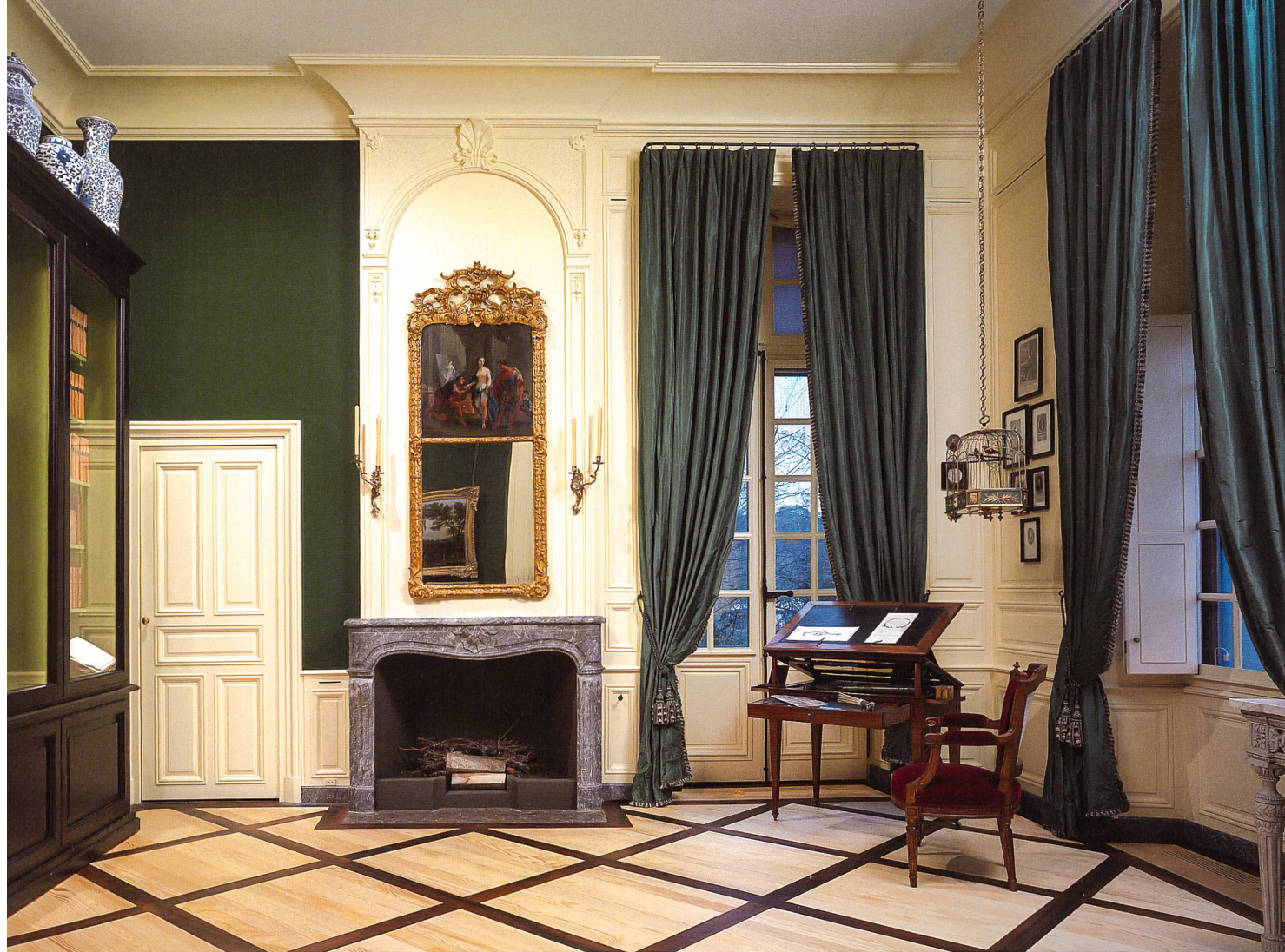
Fig. 10 La grande bibliothèque avec son étoffe de laine verte et ses lambris jaunes

Prangins sont à mi-chemin entre la restitution (peinture des boiseries, décor de faux-marbre, tissus d'ameublement) et l'évocation (choix de mobilier et d'objets emblématiques à partir d'un inventaire). Elles correspondent pleinement à la définition qu'en donne un rapport de la Commission fédérale des monuments historiques publié en 2006, à savoir des «espaces d'exposition dans lesquels des éléments architecturaux constitutifs ainsi que des meubles ont été rassemblés pour former un ensemble plus ou moins originel, mais parfaitement représentatif» 8 .