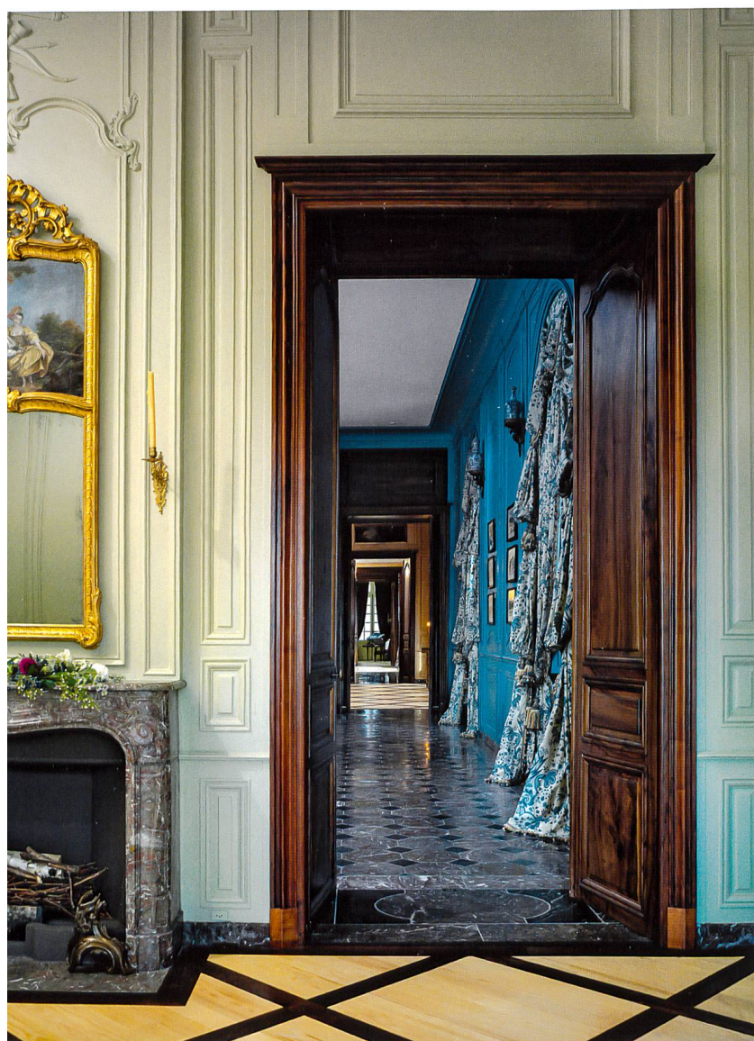
Fig. 1 Enfilade des salles de réception du château de Prangins depuis la petite salle à manger avec ses boiseries couleur vert d'eau

Plusieurs raisons ont conduit à la décision de transformer une partie de l'exposition permanente en salles historiques. Nous sommes d'abord parties de la constatation que le château de Prangins a pour particularité d'être à la fois un