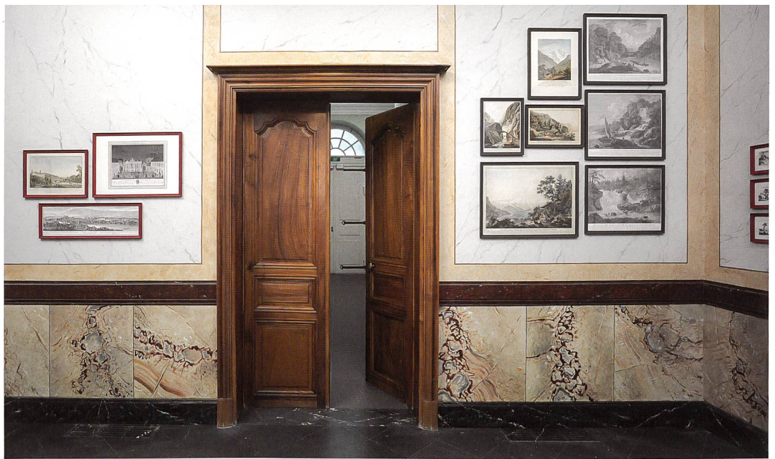
Fig. 7 Le vestibule de marbre avec le décor de faux-marbre restitué à partir d'un fragment in situ

du sol, comme le voulait l'usage. Des fragments d'un décor de faux-marbre se trouvaient par ailleurs dans le vestibule de marbre, ainsi nommé dans l'inventaire de 1787. Bien qu'ils datent du XIX e siècle, en l'absence de toute information fiable antérieure à cette époque dans les sondages à notre disposition, nous avons pris le parti de restituer ce décor sur l'ensemble des murs (fig. 4, 7). Cette option nous a paru satisfaisante dans la mesure où la disposition sur le mur des différents panneaux de faux-marbre se réfère aux modèles classiques des XVII e et XVIII e siècles. De plus, sur les quatre différents types de marbre représentés (blanc veiné de Carrare, Sarrancolin, Griotte d'Italie et Napoléon), trois sont connus au XVIII e siècle, seul le marbre dit Napoléon ne sera découvert qu'au début du siècle suivant.