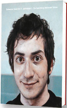
Schweizer Kunst im 21. Jahrhundert – Die Sammlung Nationale Suisse 144 Seiten, Hardcover CHF 58.– ISBN 978-3-7245-1788-7