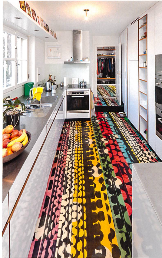
Bodenornament , tapeziert im Eingangs- und Küchenbereich eines Einfamilienhauses, von der Künstlerin Vreni Spieser.